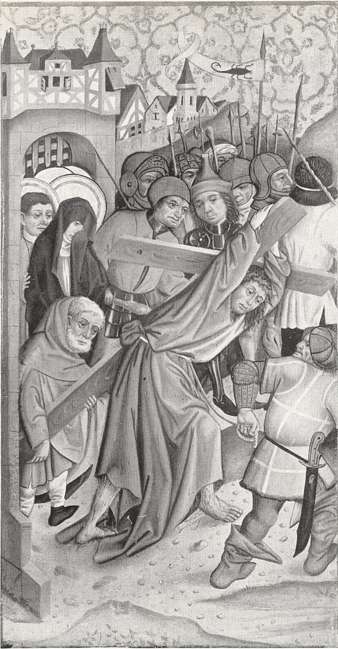
Abb. 3 Schwäbisch, Mitte 15. Jahrhundert. Kreuztragung. Stuttgart, Württembergische Staatsgalerie