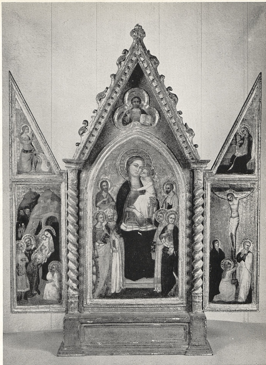
Abb. 1 Niccolò di Tommaso: Triptychon. Westdeutscher Privatbesitz