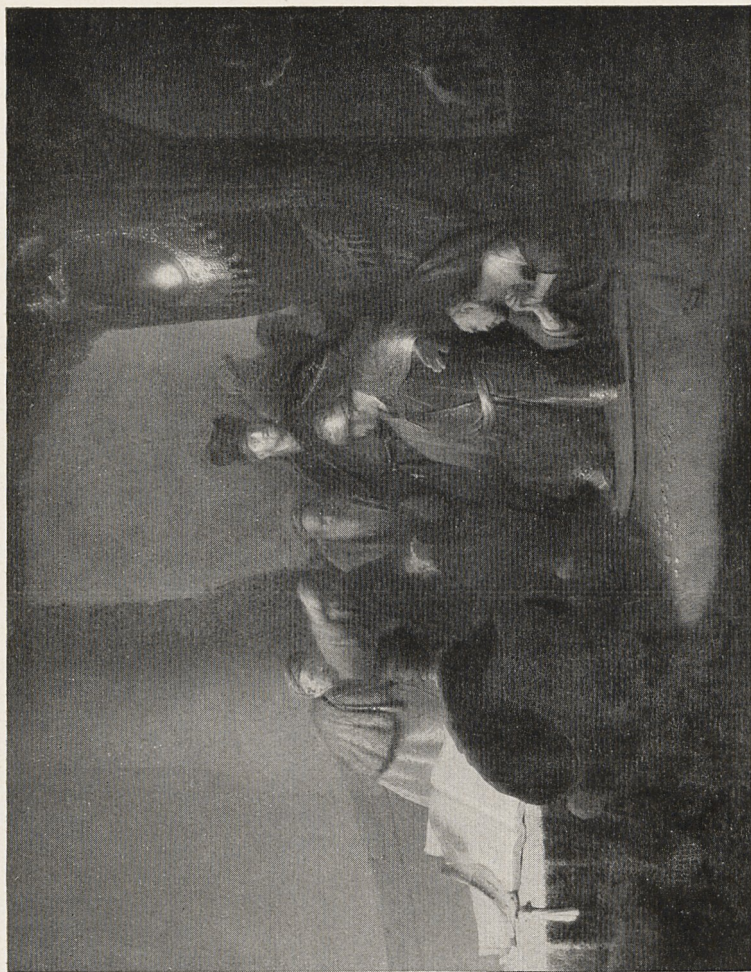
Abb. 2 Rembrandt: Judas gibt die Silberlinge zurück. 1629. Mutgrave Castle