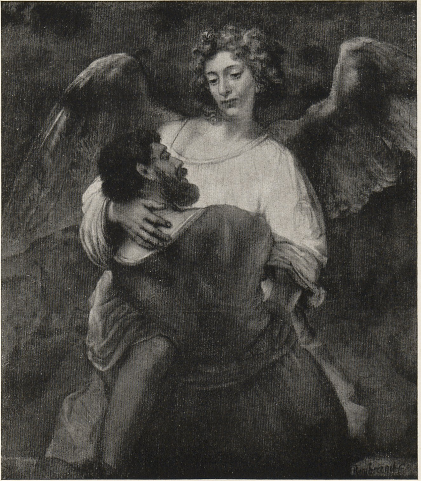
Abb. 4 Rembrandt: Jakob ringt mit dem Engel. Berlin-Dahlem, Staatl. Museen