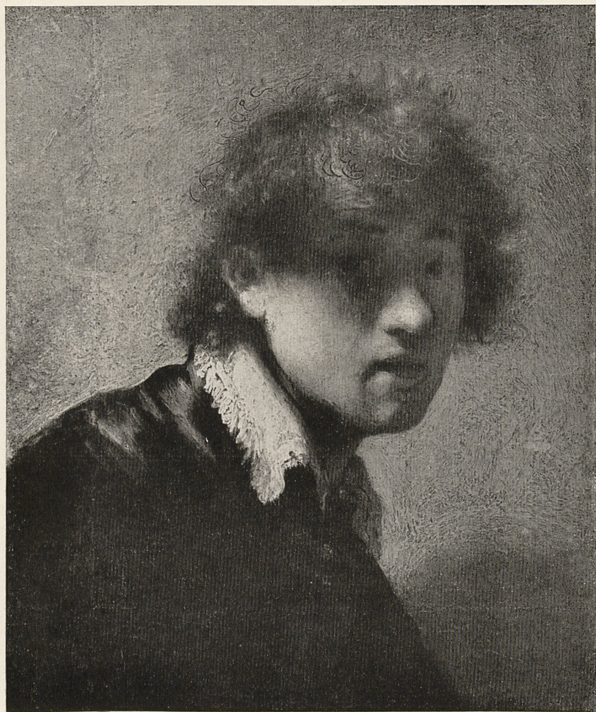
Abb. 1 Rembrandt: Selbstbildnis von 1629. München, Bayer. Staatsgemäldesammlungen