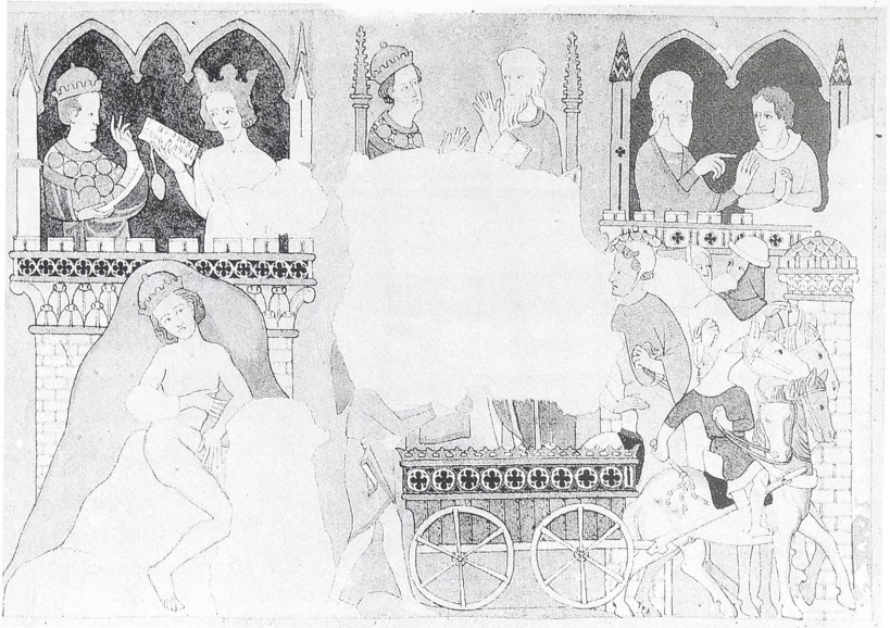
Abb. 4a Westminster, The Painted Chamber : Wundertaten des Elisäus, links unten die Heilung Naamans (Kopie von Stothard, um 1820)