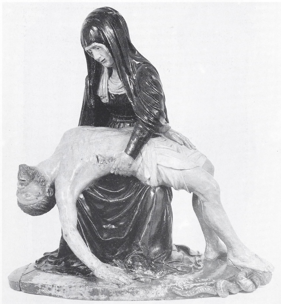
Abb. 2 Vecchietta (?), Pietà. Siena, San Donato in San Michele Arcangelo