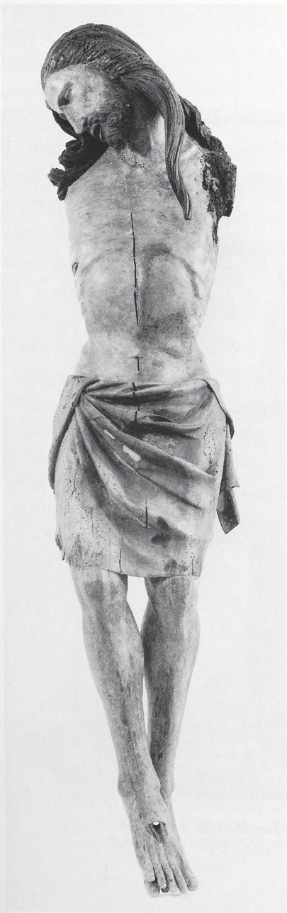
Abb. 1a Der Gekreuzigte, Fragment. Colle Val d'Elsa, Sant'Agostino