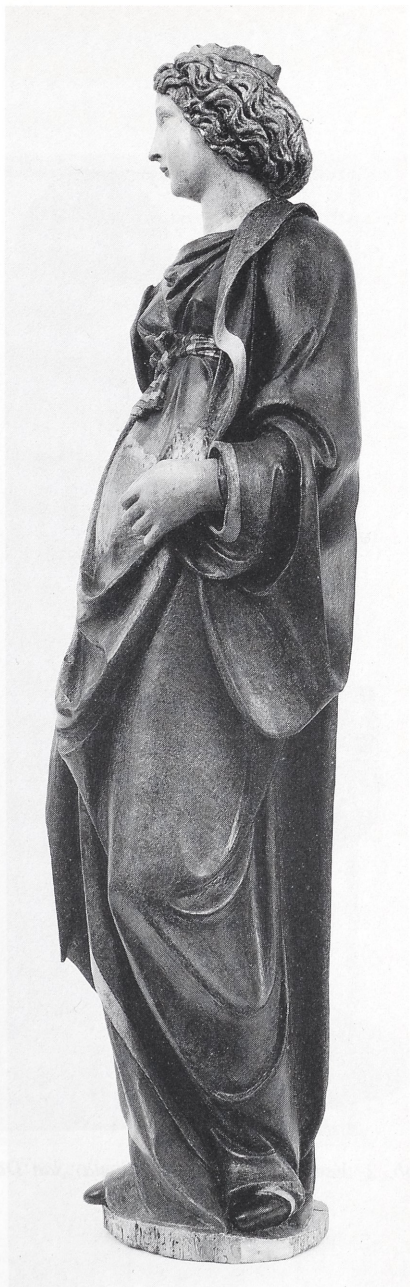
Abb. 1b Jacopo della Quercia (?), Verkündigungsmaria. Siena San Raimondo al Refugio