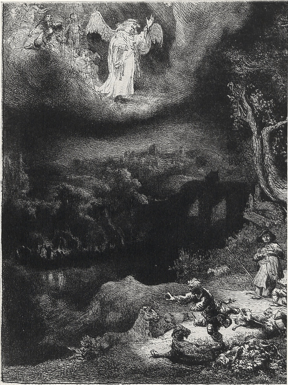
Abb. 4 Rembrandt: Anbetung der Hirten. Radierung. München, Staatl. Graph. Slgn. (aus der Stiftung der Max Kade-Foundation). Ausschnitt in Originalgröße.