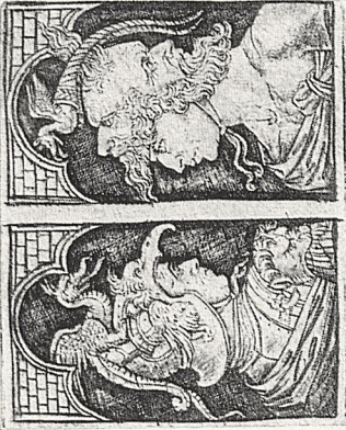
Abb. 3 b Brustbilder phantastisch be- helmter Krieger. Niello, bolognesisch E. 15. Jh. (originalgroß).