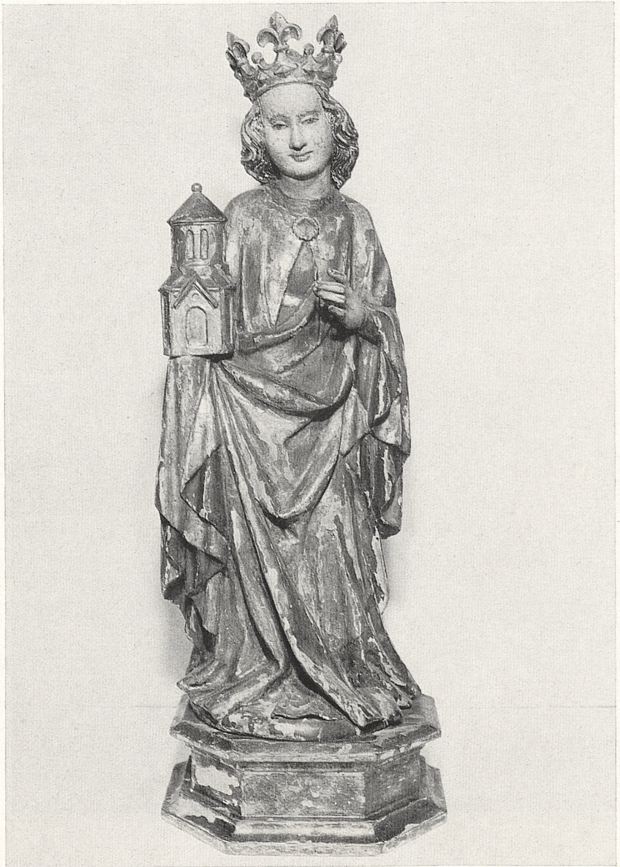
Abb. 4 Hl. Barbara. Oberrheinisch um 1430. Heidelberg, Kurpfälzisches Museum.