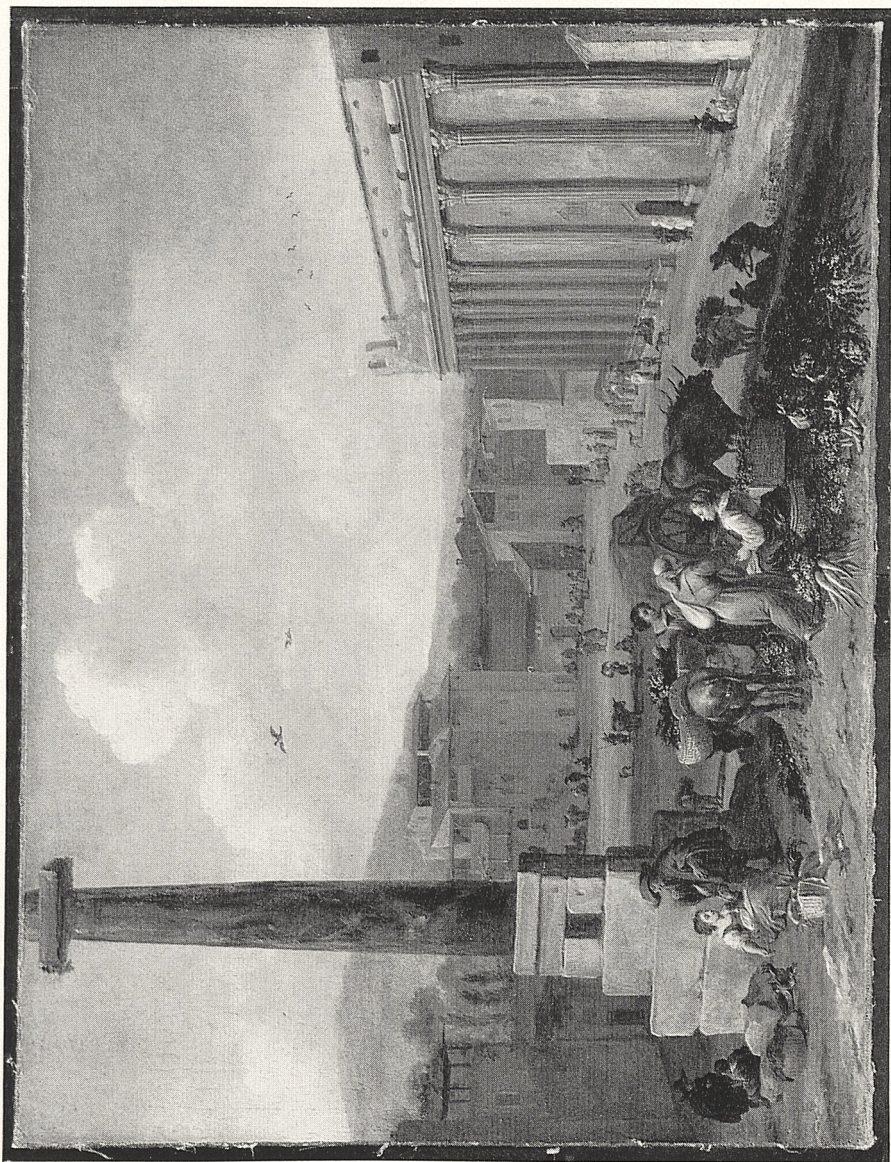
Abb. 3 Hendrick Mommers: Römische Marktszene. Aschaffenburg, Schloßgalerie der Bayerischen Staatgemäldesammlungen.