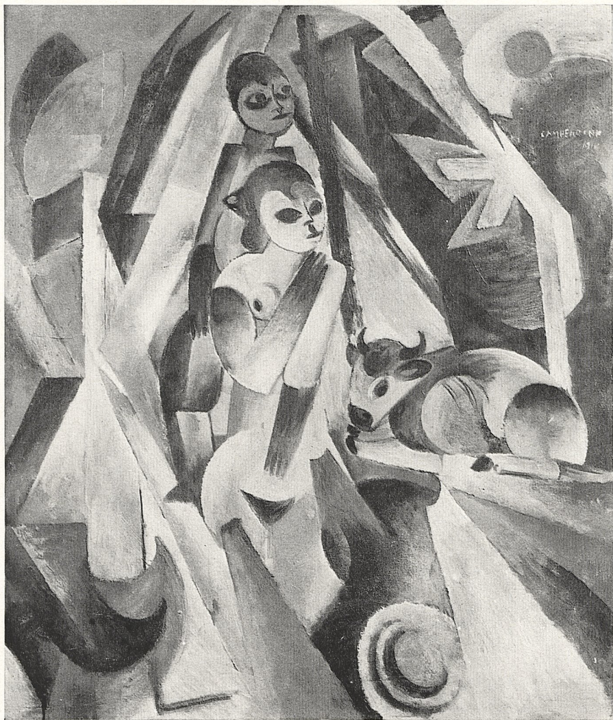
Abb. 1 Heinrich Campendonck: Badende Mädchen (1914). Heidelberg, Kurpfälzisches Museum.