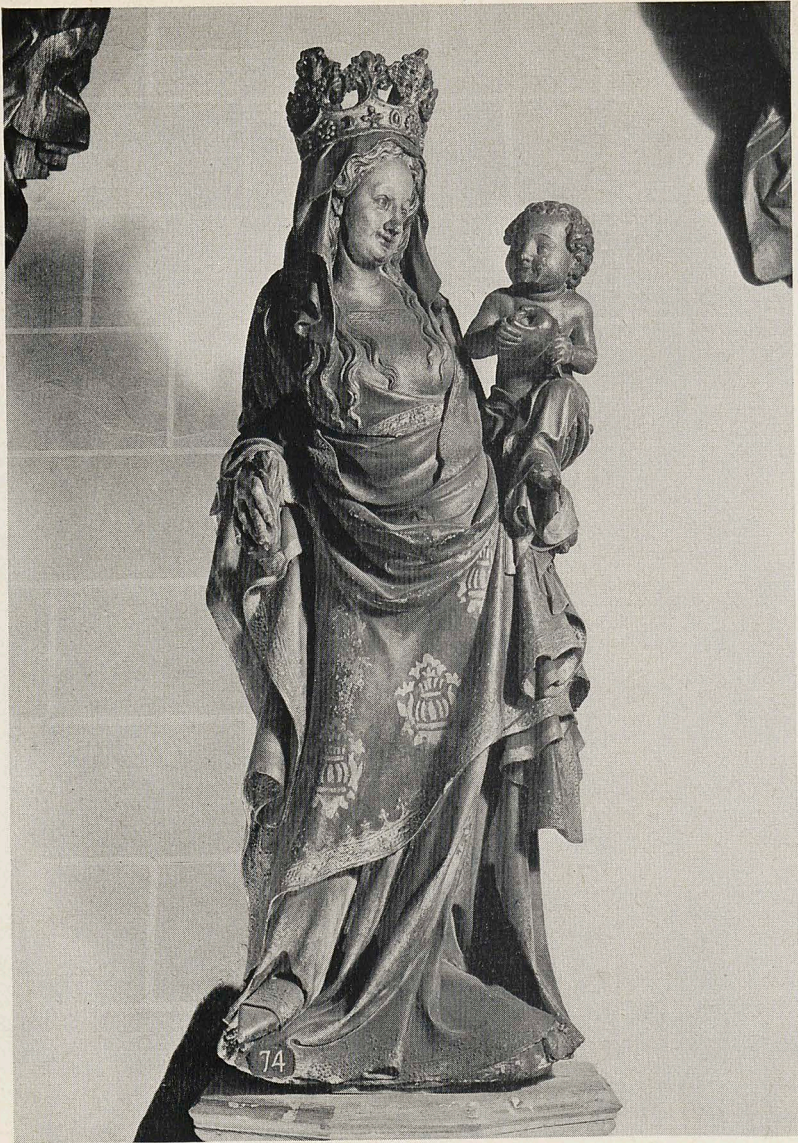
Abb. 4 Stehende Muttergottes aus Brügge. Letztes Viertel 14. Jahrhundert. Antwerpen, Museum Mayer van den Bergh