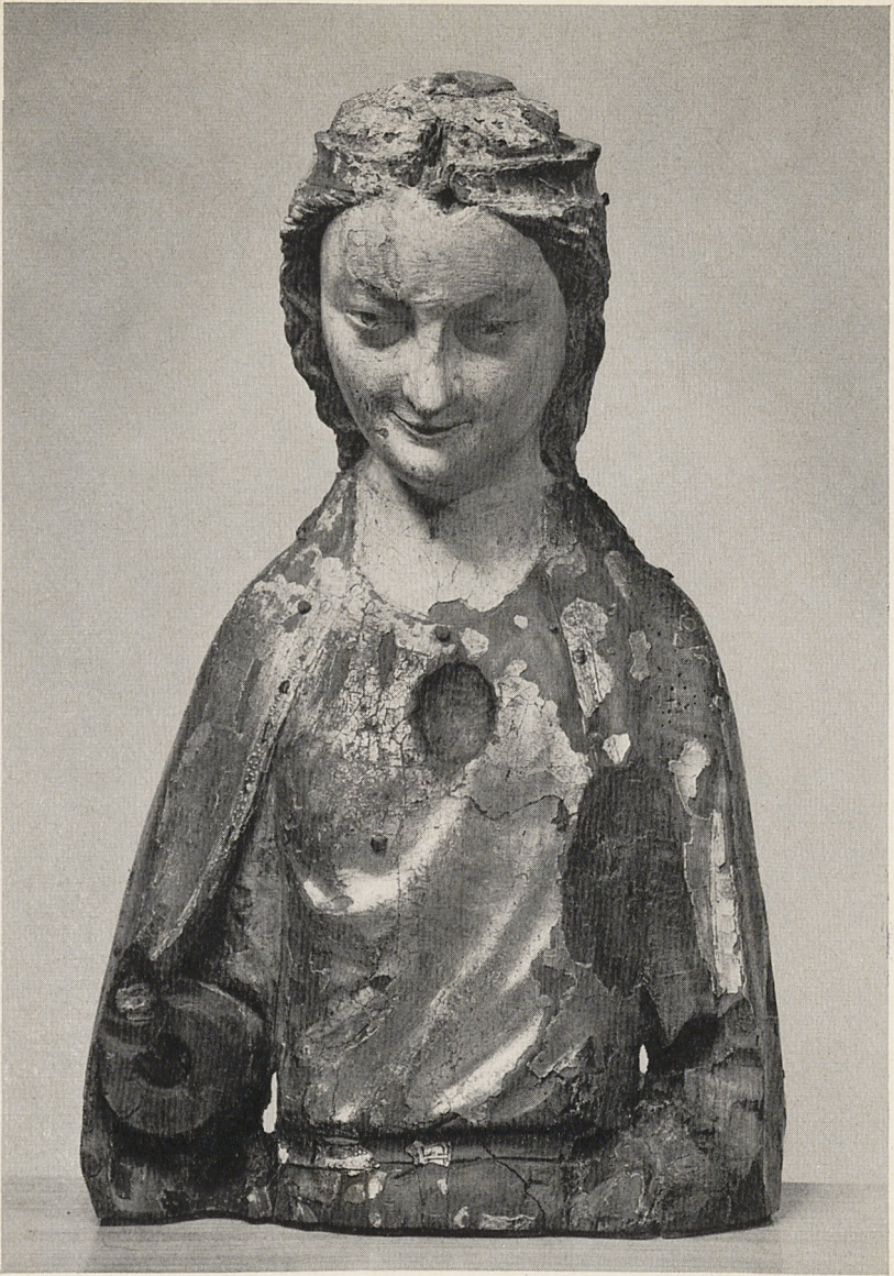
Abb. 1 Fragment einer thronenden Muttergottes. Köln, Anfang 14. Jahrhundert. Antwerpen, Museum Mayer van den Bergh