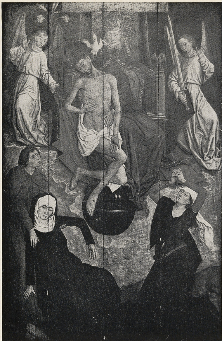
Abb. 2 Vrancke van der Stockt: Gnadenstuhl. Caltagirone, S. Giorgio Vecchio