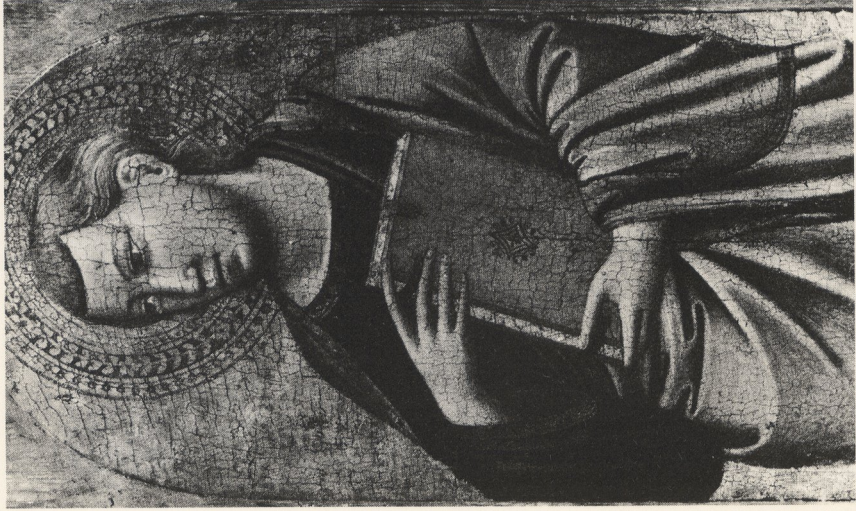
Abb. 4a Taddeo Gaddi, S. Giovanni Evangelista. Privatbesitz