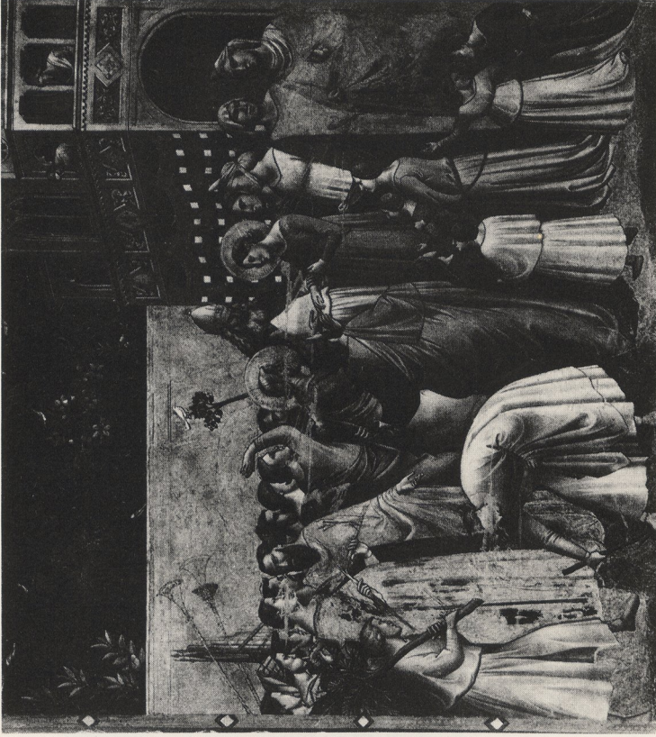
Abb. 4b Taddeo Gaddi, Die Hochzeit Marius. Florenz, S. Croce, Baroncellikapelle