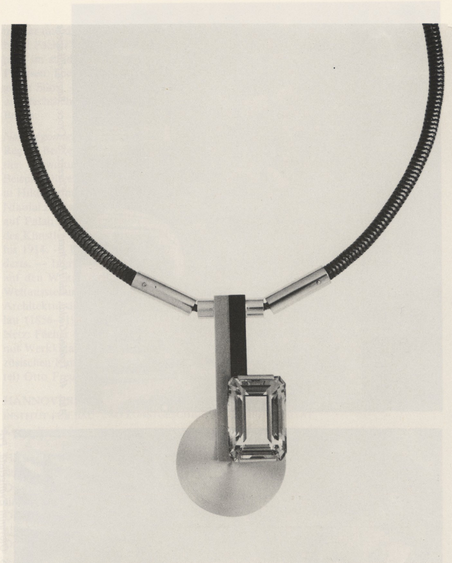
Abb. 3 Jean Fouquet, „Collier mit Anhänger“, um 1925—1930