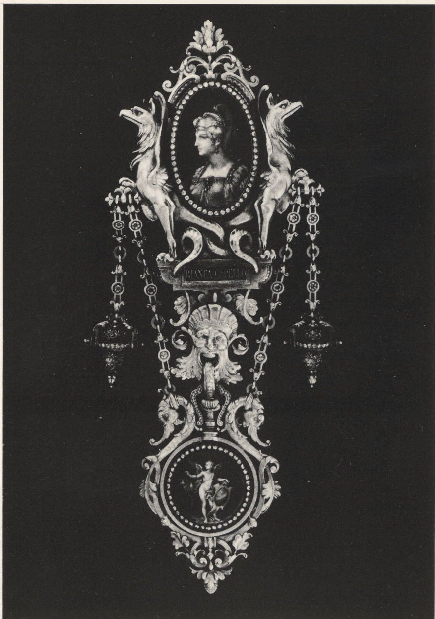
Abb. 1 Alphonse Fouquet, „Chatelaine Bianca Capello”, 1878. Paris, Musée des Arts Décoratifs (M. Perez, CH-8424 Embrach)