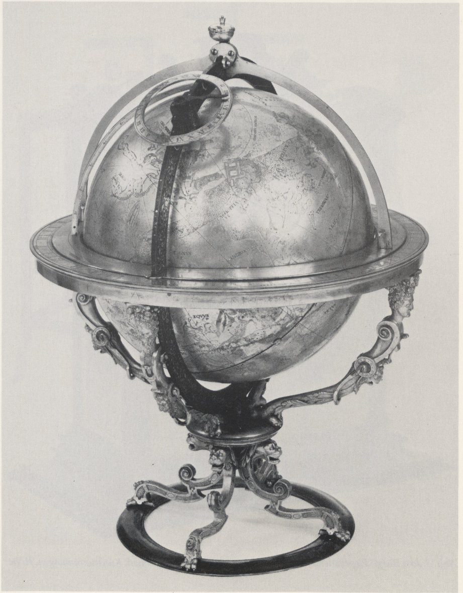
Abb. 4 Eberhard Baldewein: Uhrwerkgetriebener Himmelsglobus. Marburg, 1575. London, Privatbesitz. Höhe: 55,6 cm