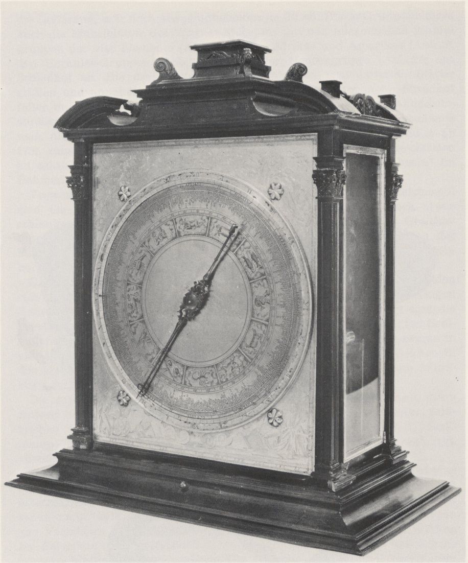
Abb. 3 Jost Bürgi: Experimentieruhr. Kassel, um 1585/90. Kassel, Staatl. Kunstsammlungen. Höhe: 36,5 cm