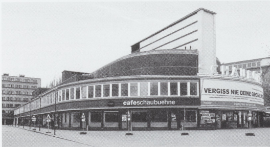
Abb. 2 Berlin, „Universum“-Kino am Lehniner Platz, Ansichten vor und nach dem Abriss sowie nach der Wiederherstellung als Schaubühne. Fotografien vor/nach 1979 und 1981 (Kat. S. 357)

zu fassen noch war sie dominant. Aus dem reinen Traditionsargument läßt sich zudem keine Notwendigkeit der Fortführung dessen, was es angeblich schon immer gab, ableiten.