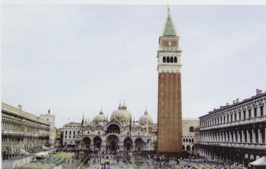
Abb. 1 Venedig, der Campanile von San Marco vor dem Einsturz, danach und im heutigen Zustand. Fotografien um 1900, nach 1902 und 2006 [Kat. S. 343]