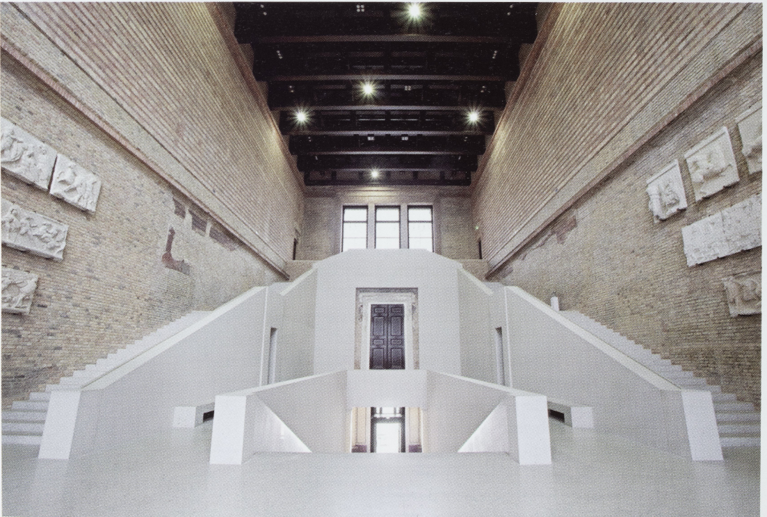
Abb. 4 David Chipperfield, Neues Museum Berlin, Blick in die Treppenhalle, 2003-2009

Die Chance bestehe darin, „die ohnehin unvermeidliche formale und semantische Abweichung als Herausforderung zu betrachten und kulturell produktiv zu machen“ ( Denkmalpflege statt Attrappenkult , 137). Der Berliner Sprachphi-