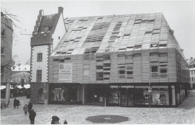
Abb. 3 Massimiliano Fuksas, Mainzer Einkaufszentrum mit wiederhergestellter Markthäuserfassade, 2007-2009 (Kat. S. 459)

die „Selbstverortung in der Geschichte“ (17), die jedoch nur allzuleicht in einen manipulativen Geschichtskonstruktivismus und somit in die Instrumentalisierung von Vergangenheit für die Wünsche und Ziele der Gegenwart ableitet: „Eine Rekonstruktion kann immer nur so wahrhaftig sein, wie die Absichten, die hinter ihr stehen. Dient sie der Stilisierung ihres Bauherrn, werden Quellen und Originalsubstanz manipuliert. Gebaute Geschichtspolitik verlangt Vereinfachung. Die Darstellung komplexer Entwicklungen und historischer Widersprüche stört die Plausibilität ihrer Inszenierung.“ (37)