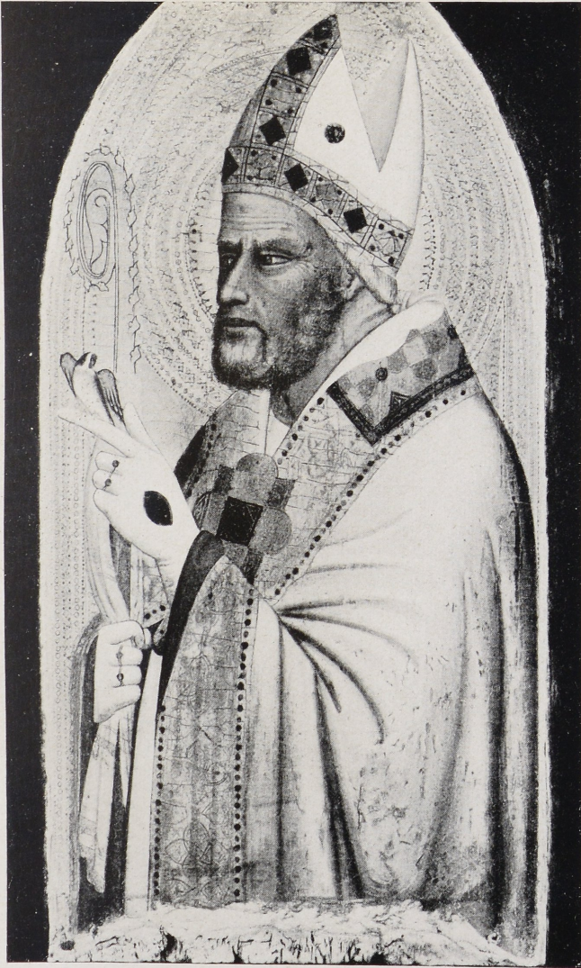
Abb. 1 Florentinisch um 1360: Heiliger Bischof München, Alte Pinakothek