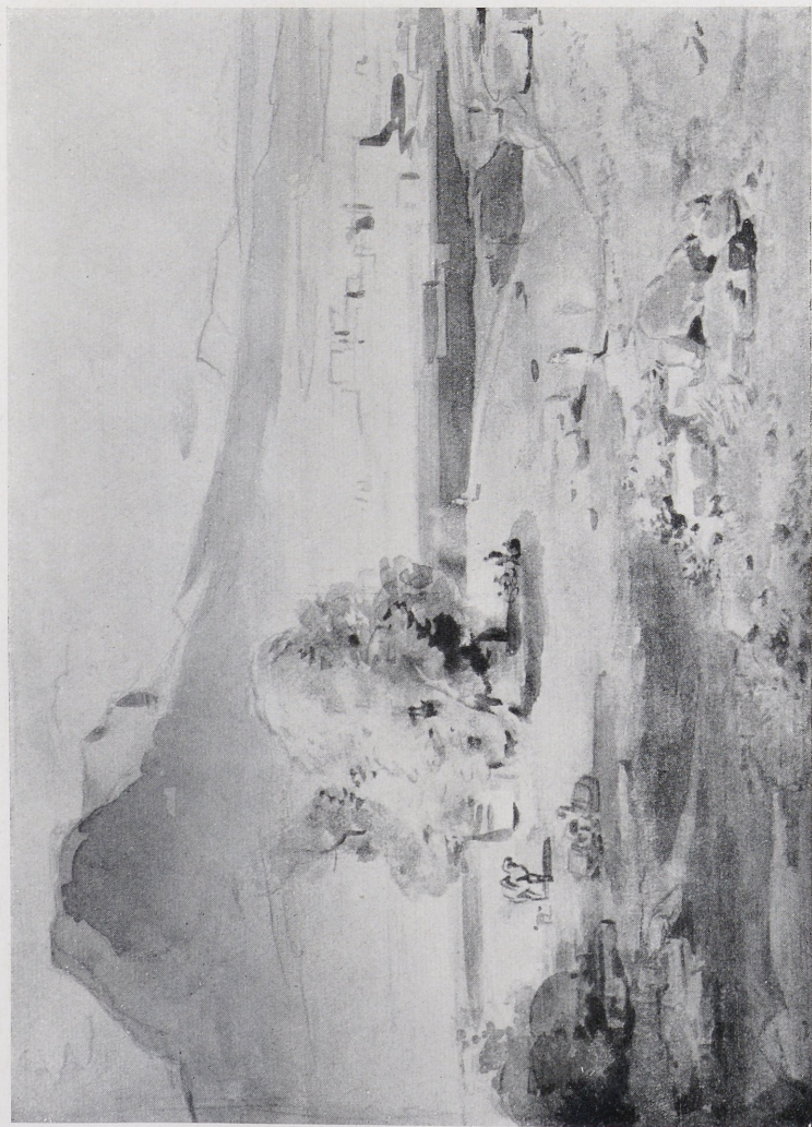
Abb. 3. Carl Rottmann: Korinthe. Aquarell, um 1835. Heidelberg, Kurpfälzisches Museum