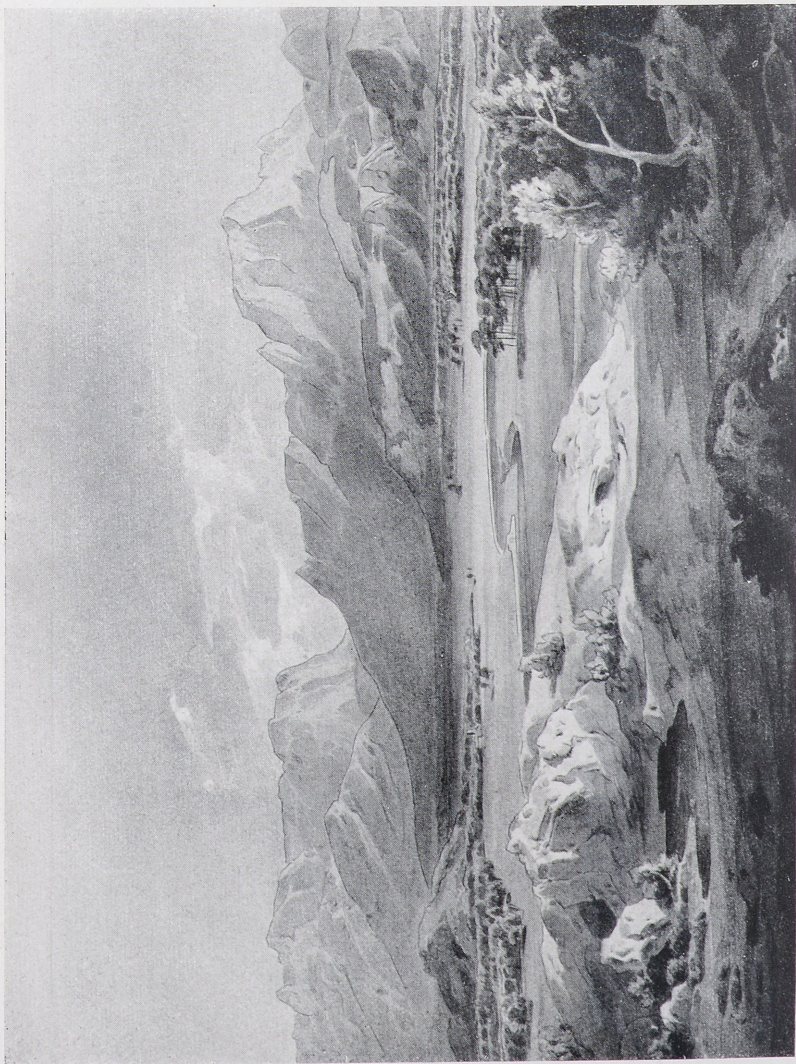
Abb. 2. Carl Rottmann: Oberbayerische Gebirgslandschaft. Aquarell, 1826. Worms, Frb. Heyl zu Herrnsheim