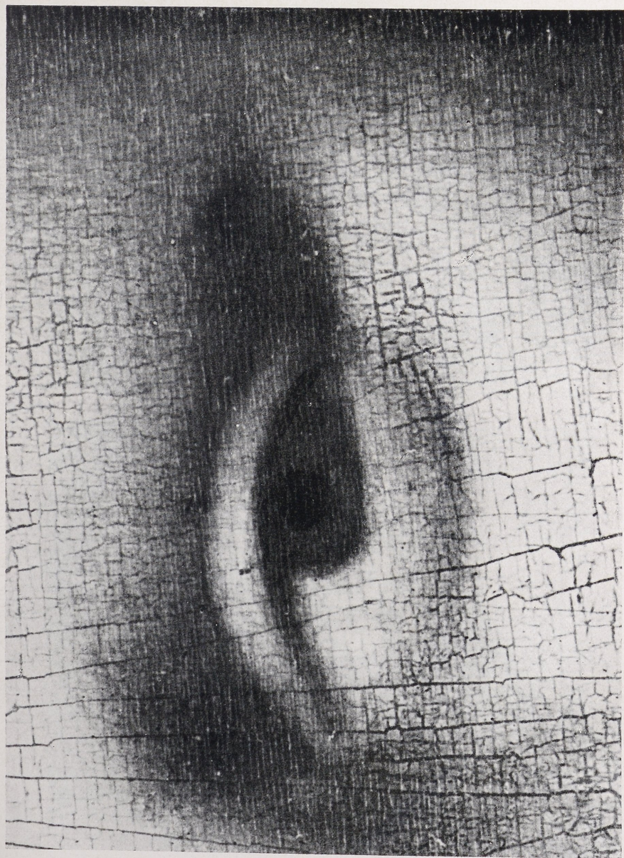
Abb. 4 Mona Lisa (Ausschnitt; etwa auf das Doppelte vergrößert)