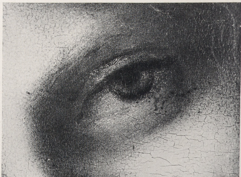
Abb. 5 Bacchus (Ausschnitt) Abb. 6 Johannes d. T.f. (Ausschnitt) (Jeweils um etwa \frac{1}{5} vergrößert)