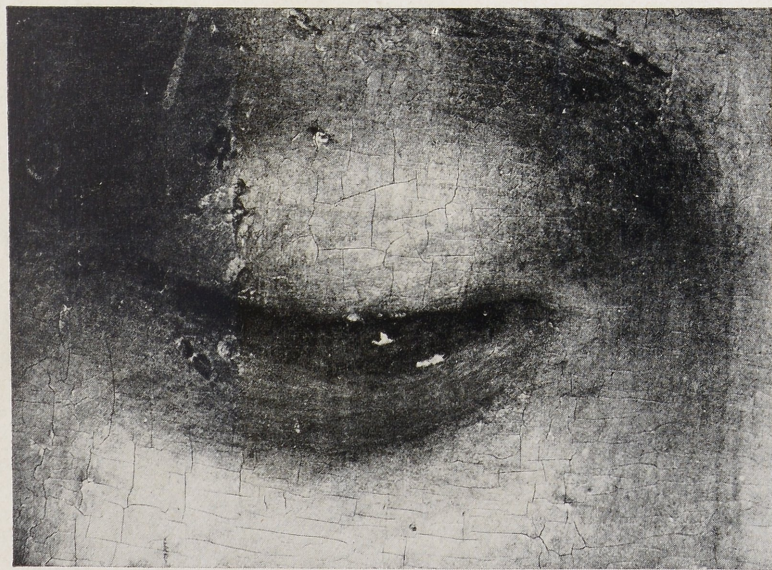
Abb. 1 Hl. Anna Selbdritt (Ausschnitt) Abb. 2 Felsgrottenmadonna des Louvre (Ausschnitt) (Jeweils um ca. \frac{1}{5} vergrößert)