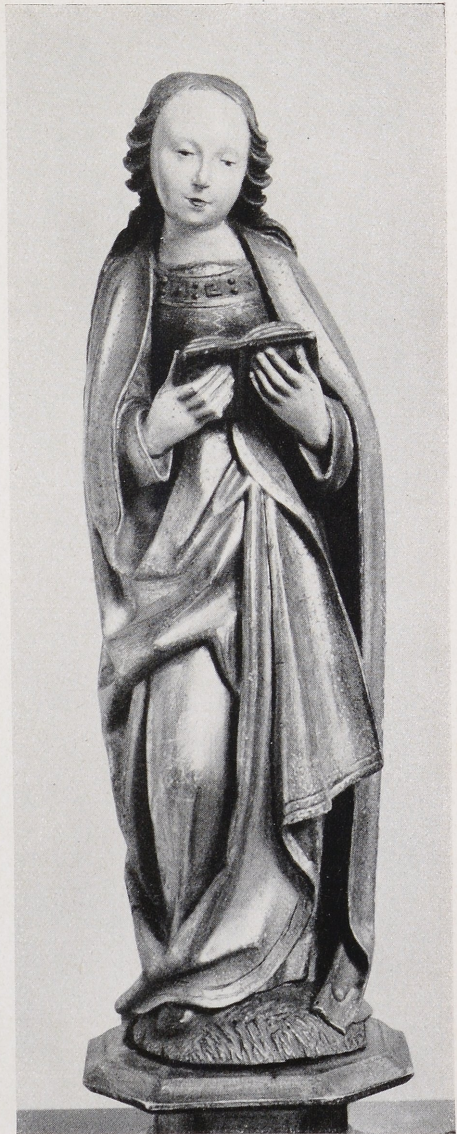
Abb. 4 Köln, 3. Viertel 15. Jahrhundert: Maria (?)

Bonn, Rhein. Landesmuseum (Stiftung Dr. Fritz Thyssen)