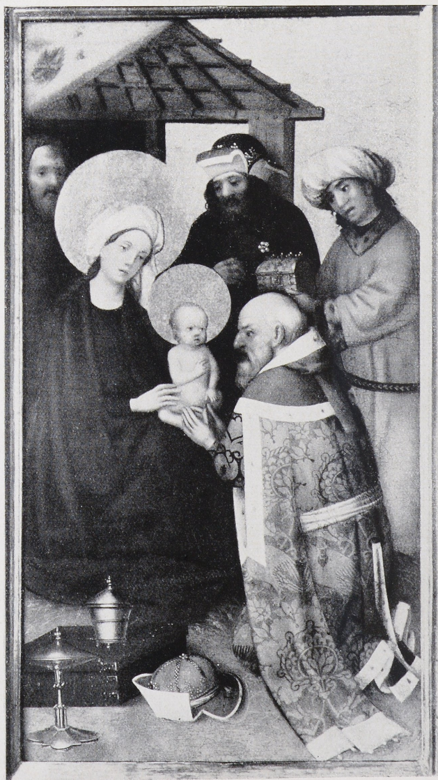
Abb. 7 Nachfolger Stephan Lochners: Anbetung der Könige Bonn, Rhein. Landesmuseum (Stiftung Dr. Fritz Thyssen)