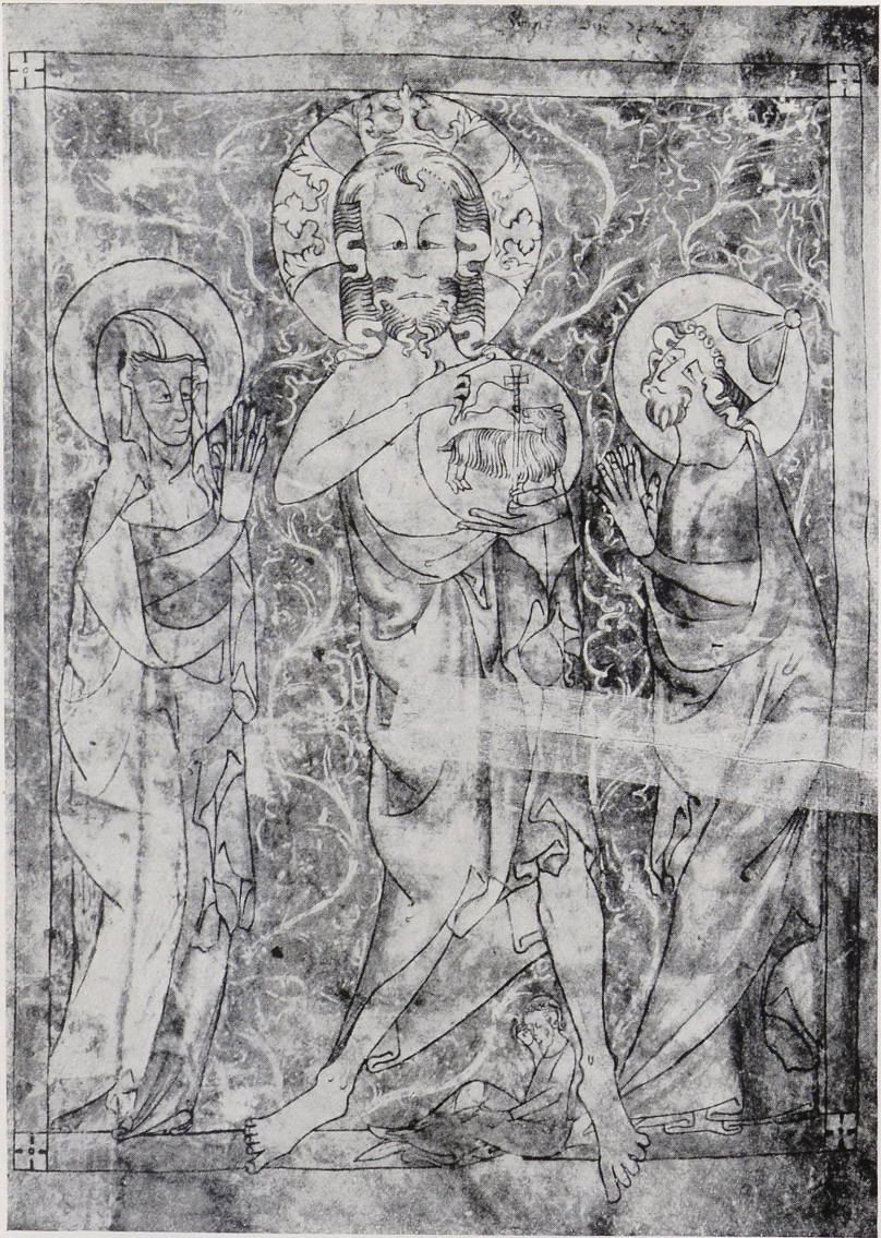
Abb. 8 Island, 14. Jahrhundert: Christus zwischen Maria und Johannes (?) Kopenhagen, Univ.-Bibl., Arnamagnaenske Saml. 233 a