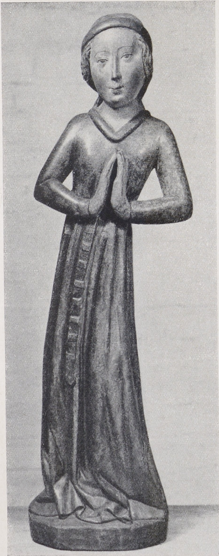
Abb. 3 Westdeutsch, Mitte 14. Jahrhundert: Maria als Tempeljungfrau

Bonn, Rhein. Landesmuseum (Stiftung Dr. Fritz Thyssen)