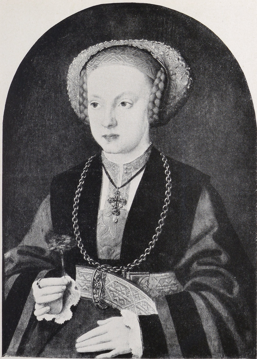
Abb. 6 Barthel Bruyn d. Ä.: Mädchenbildnis Bonn, Rhein. Landesmuseum (Stiftung Dr. Fritz Thyssen)