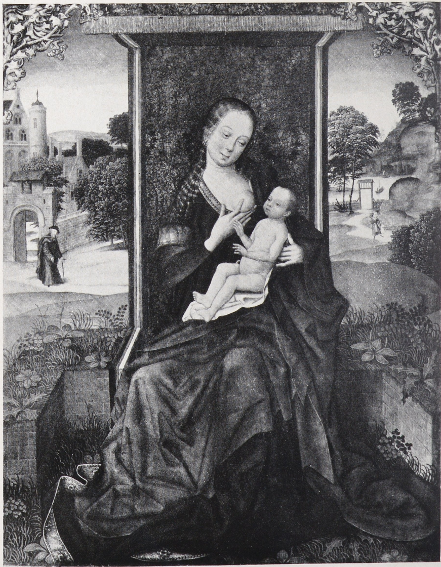
Abb. 5 Derick Baegert: Maria mit dem Kinde Bonn, Rhein. Landesmuseum (Stiftung Dr. Fritz Thyssen)