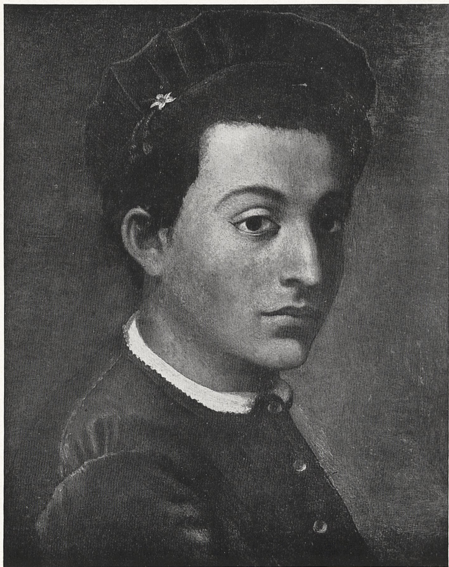
Abb. 4 Sebastiano del Piombo: Bildnis. Privatbesitz