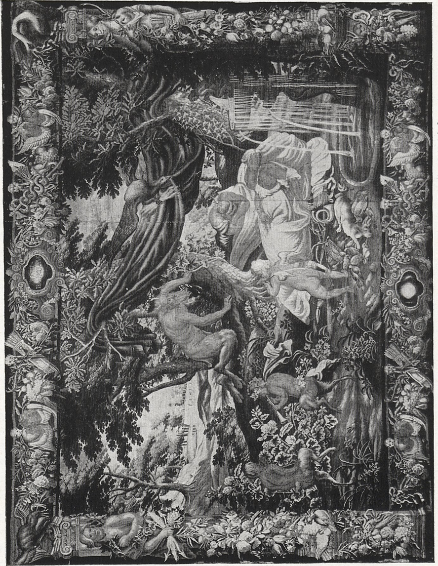
Abb. 2 Wandteppich, Brüssel (?), Mitte 17. Jhdt., Bruchsal, Schloß