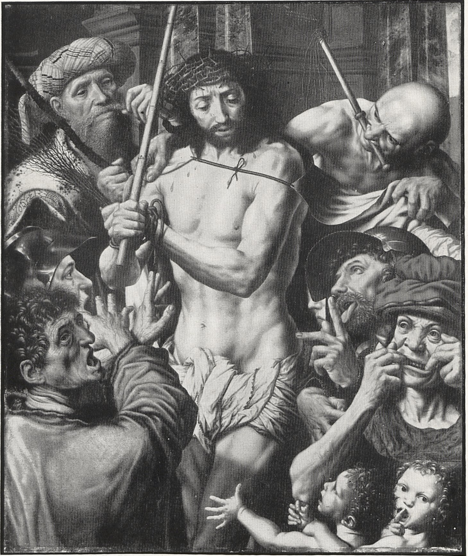
Abb. 1 Jan Sanders van Hemessen: Die Verspottung Christi. München, Alte Pinakothek