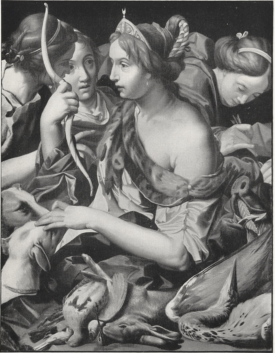
Abb. 4 Abraham Janssens: Diana mit ihren Nymphen. München, Alte Pinakothek