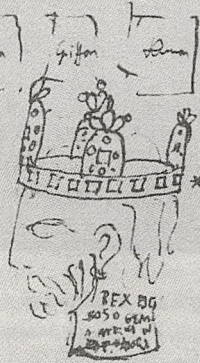
Abb. 2b Paris, Bibl. Nat. Lat. 17 558 fol. 28v

Il y avoit encore une croix d'or jaunie de viennæ. au centre de laquelle est y a un fonceil y a une croix représentant le tefo de sainte Helene surmonte de trois rayons.