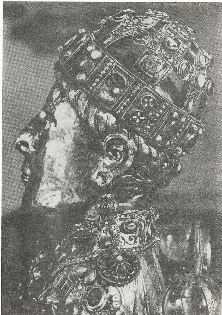
Abb. 3 Reliquiar der hl. Fides. Conques, Ste. Foy