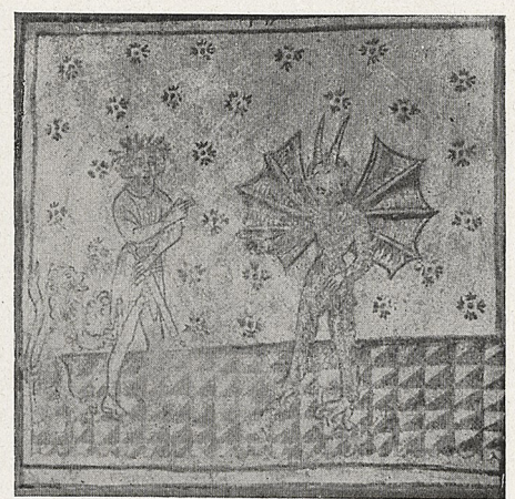
Abb. 4—5 Karden, Wandmalereien in der