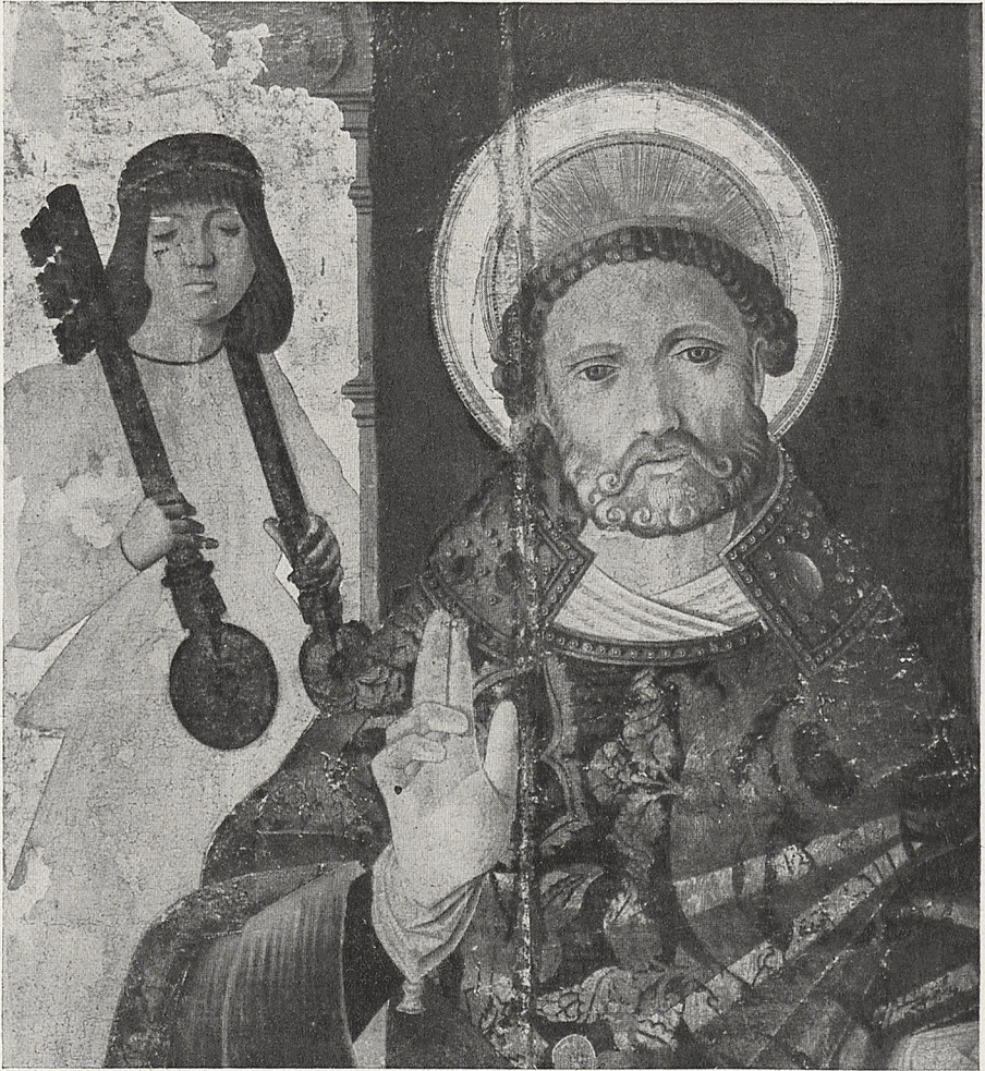
Abb. 6 Maestro della Croce die Piazza Armerina: Thronender heiliger Petrus (Ausschnitt aus einer Altartafel). Militello Val di Catania, Chiesa di S. Maria la Stella