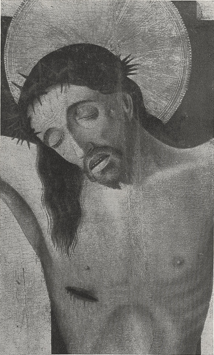
Abb. 7 Maestro della Croce di Piazza Armerina: Christus am Kreuz (Ausschnitt aus einem doppelseitig bemalten Kruzifix). Piazza Armerina, Chiesa Madre