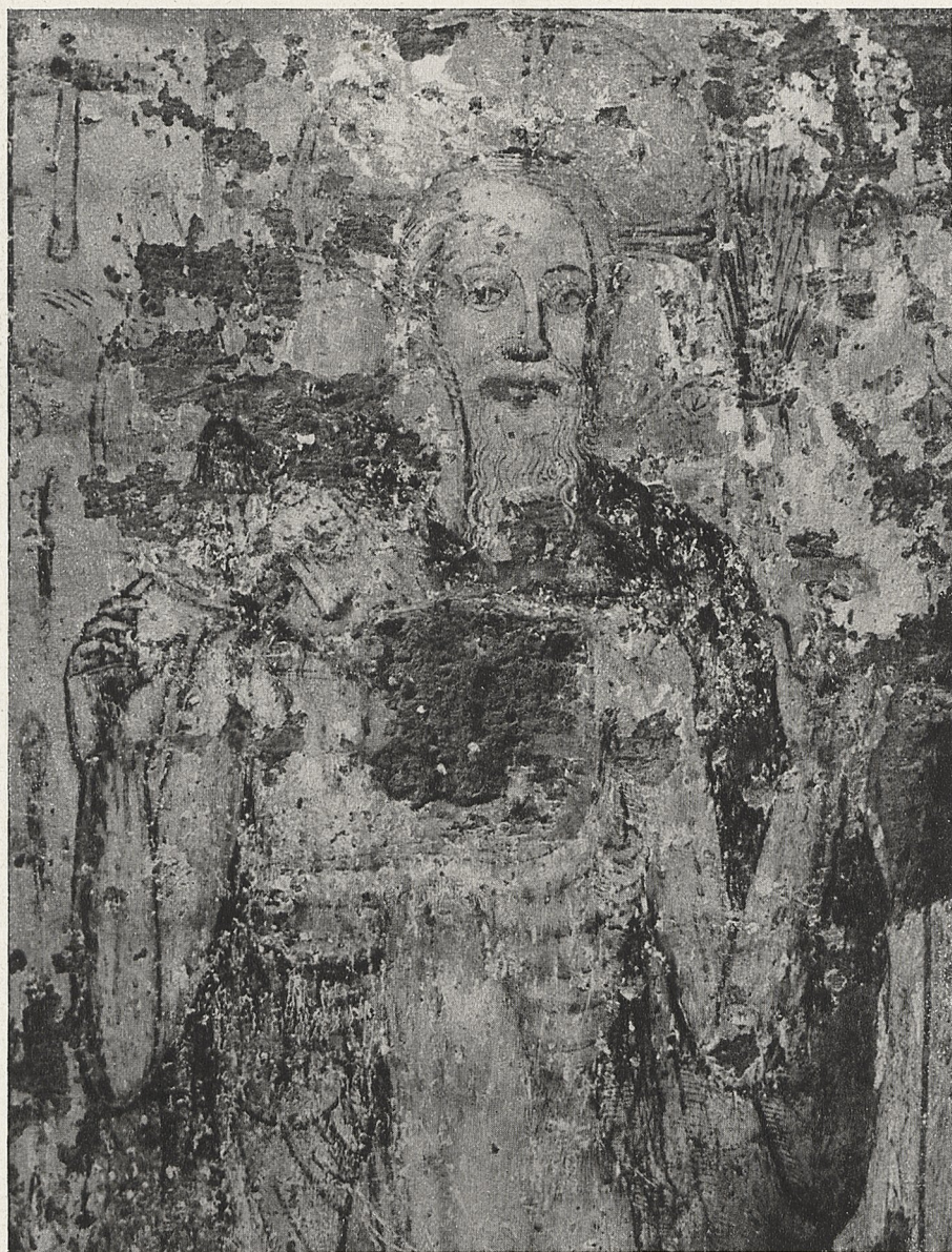
Abb. 1 Köln-Dünnwald, Wandgemälde in der Kirche des ehemaligen Prämonstratenserinnen-Klosters (Ausschnitt)