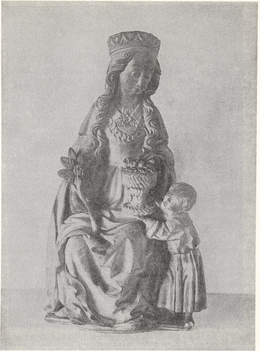
Abb. 2 Johann Brabender: Hl. Dorothea, Altena, Slg. Thomée