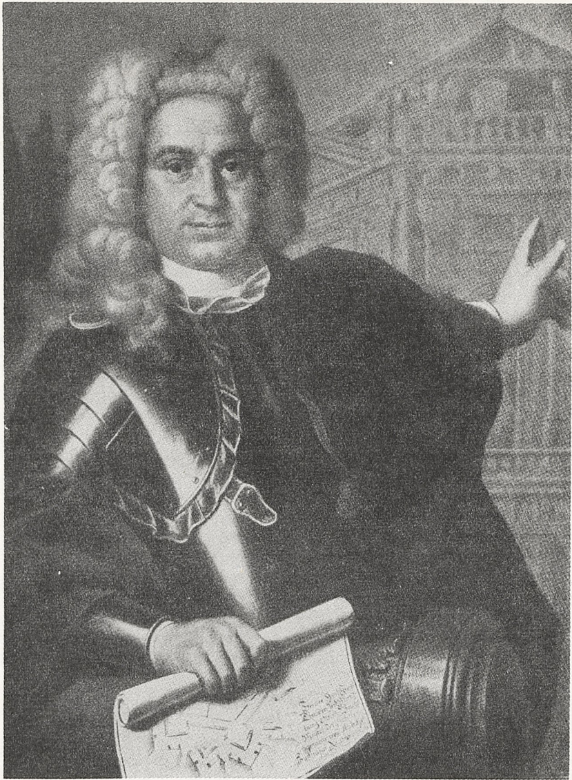
Abb. 1 M. F. Kleinert: Balthasar Neumann. 1727. Würzburg, Mainfränkisches Museum