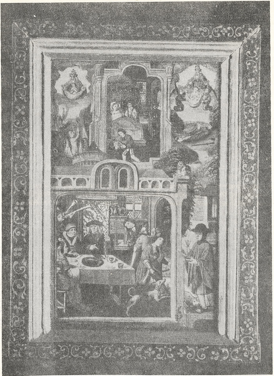
Abb. 3 Niederdeutsch, um 1500: Ars moriendi, Aliena