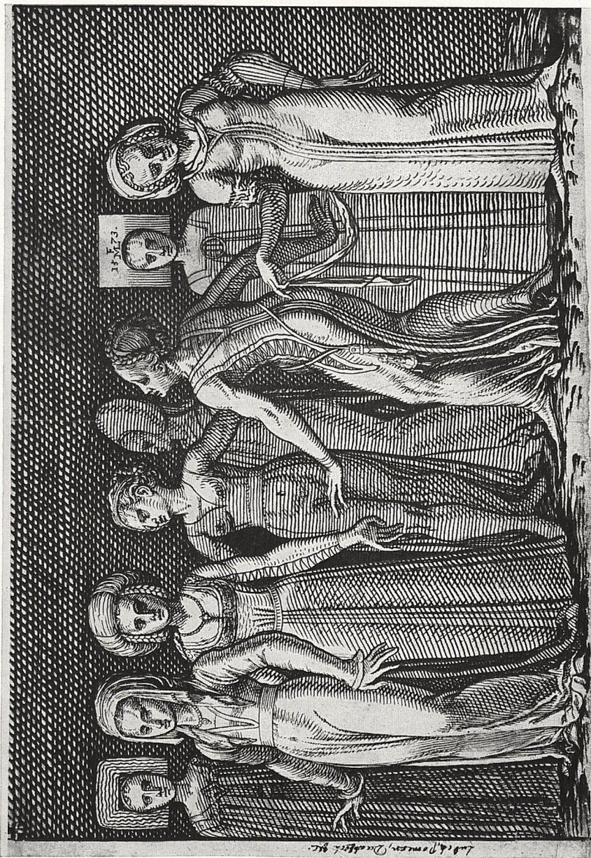
Abb. 3 Melchior Lorch: Frauen aus Litbeck, Pommern und Danzig, 1753. The Evelyn Collection, Stonor Park, England