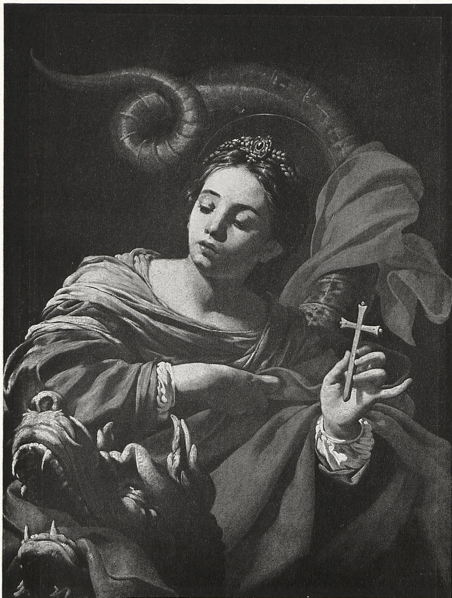
Abb. 1 S. Simon Vouet: Hl. Martha . Hartford, Conn., The Wadsworth Atheneum