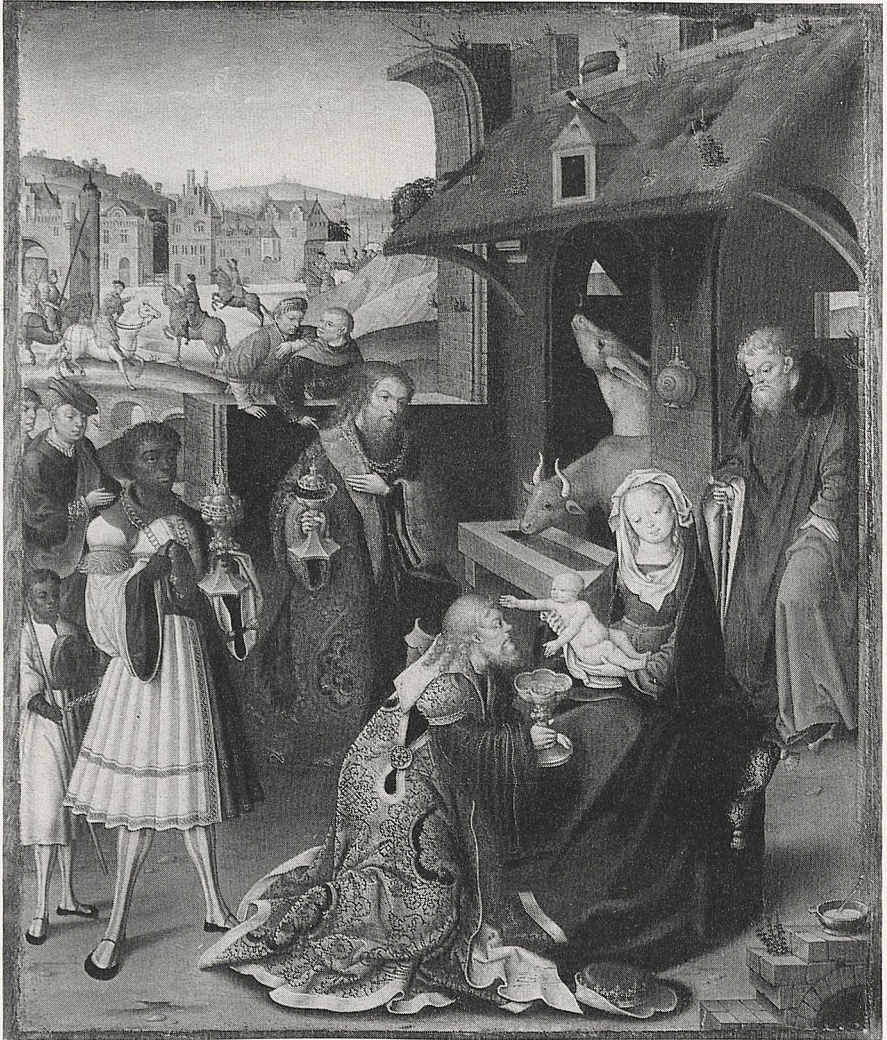
Abb. 3 Jan Bargaert: Anbetung der Könige. Brüssel, Privatbesitz