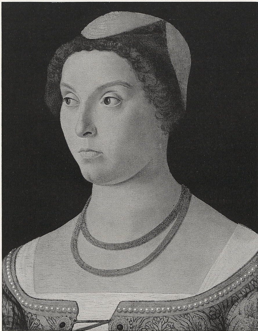
Abb. 1 Carpaccio (?); Amsterdam, Ryksmuseum