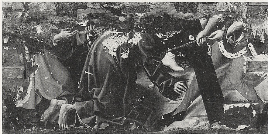
Abb. 2 Westfälischer Meister (?): Vorder- und Rückseite eines Altarflügels. Dortmund, Museum für Kunst und Kulturgeschichte