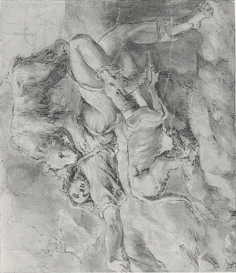
Abb. 2 Polidoro da Caravaggio: Entwurf für eine ungedeutete Komposition. Paris, Cabinet des Dessins