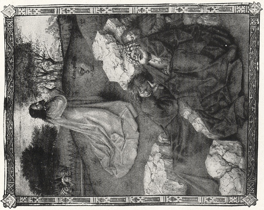
Abb. 8a Jan van Eyck: Gebetbuch. Turin, Museo Civico