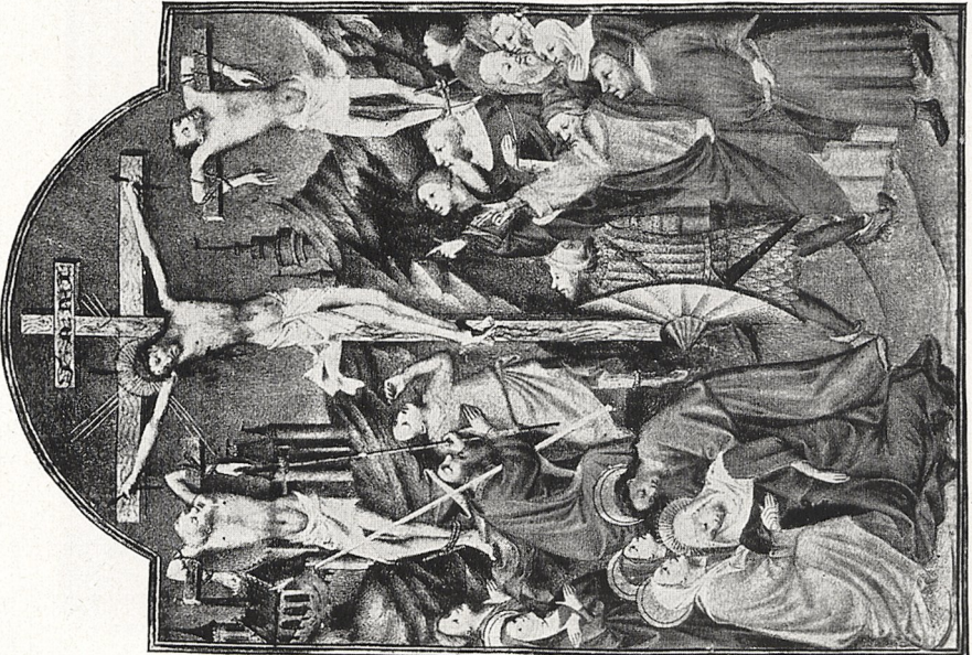
Abb. 6a Paul von Limburg. Brevier Johannis ohne Furcht. London