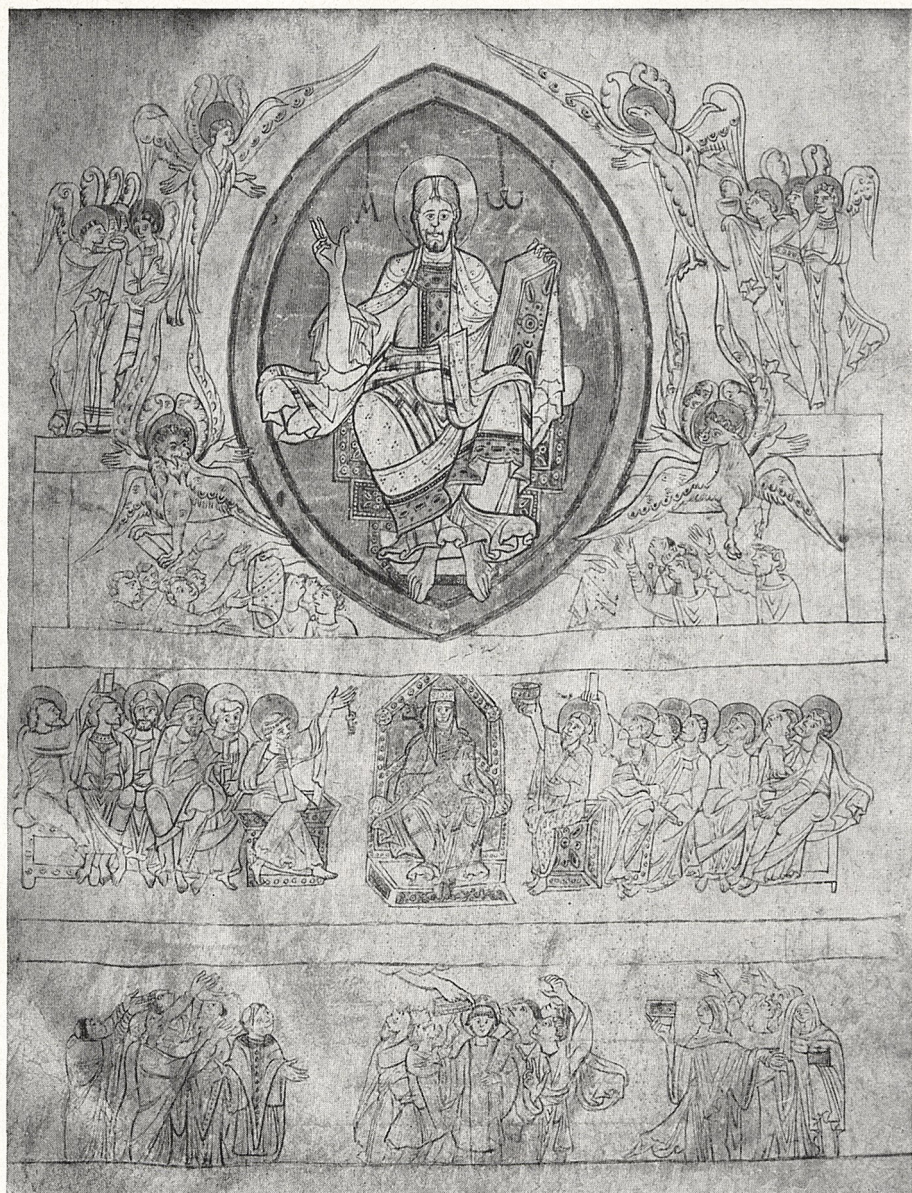
Abb. 2 Paris, Bibliothèque Nationale Lat. 11751