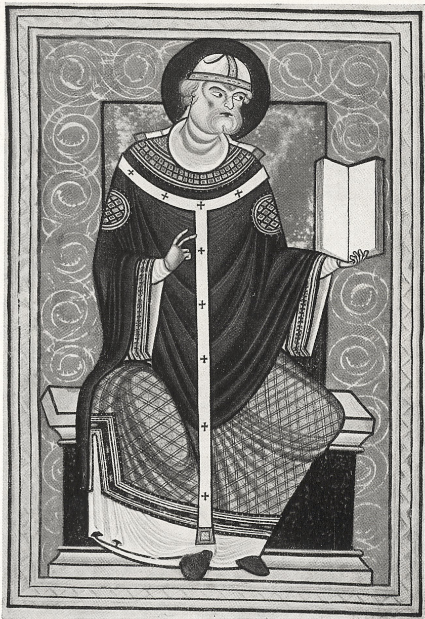
Abb. 5 Paris, Bibliothèque Nationale Lat. 2287