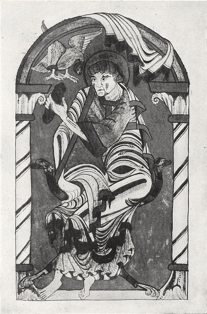
Abb. 3 Amiens, Bibliothèque Municipale Ms. 24