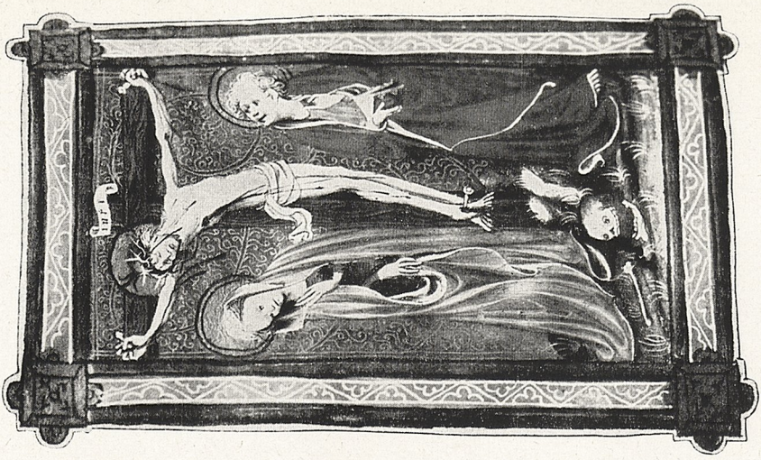
Abb. 8b Geldrischer (?): Meister um 1405—1410: Gebetbuch. Lüttich Ms. 35