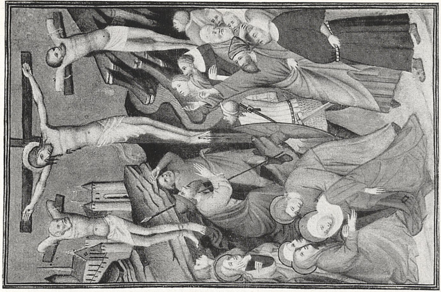
Abb. 6b Unbekannter Meister: Gebeibuch des Herzogs von Berry 11060/1. Brüssel