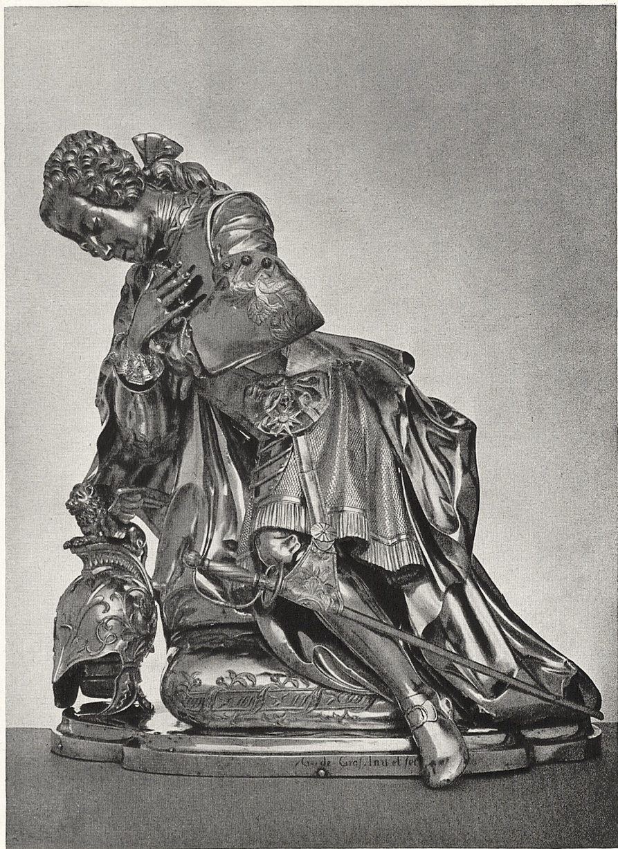
Abb. 1 Wilhelm de Groff: Silberstatue des Kurprinzen Maximilian Joseph 1737. Altötting, Gnadenkapelle