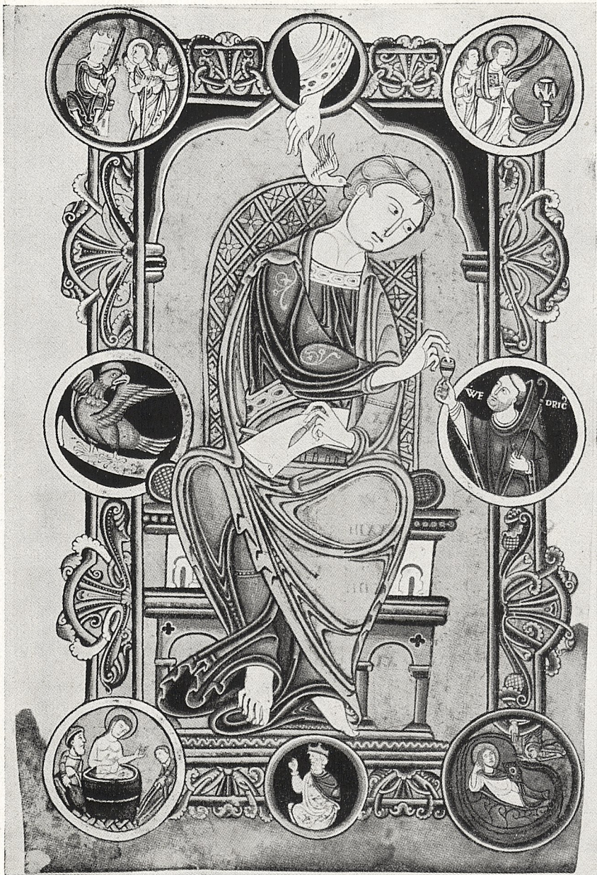
Abb. 4 Avesnes, Société Archéologique