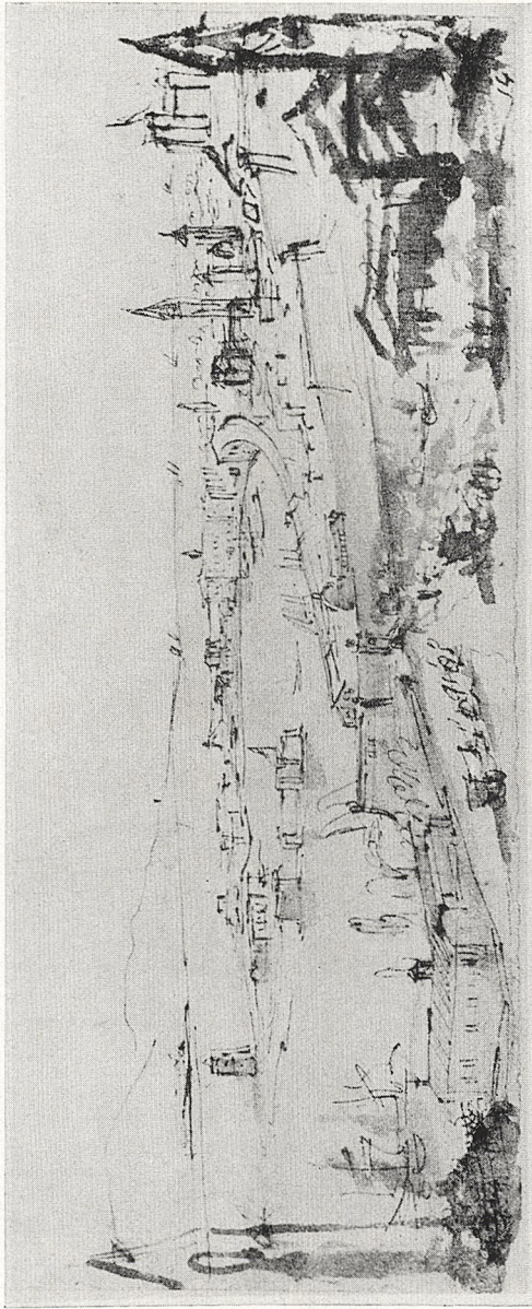
Abb. 3 Filippo Juvarra: Hafensicht von Messina. Turin, Museo Civico