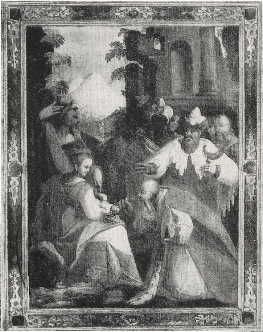
Abb. 1 Schlesischer Meister um 1613: Anbetung der Könige. Lüben, Pfarrkirche