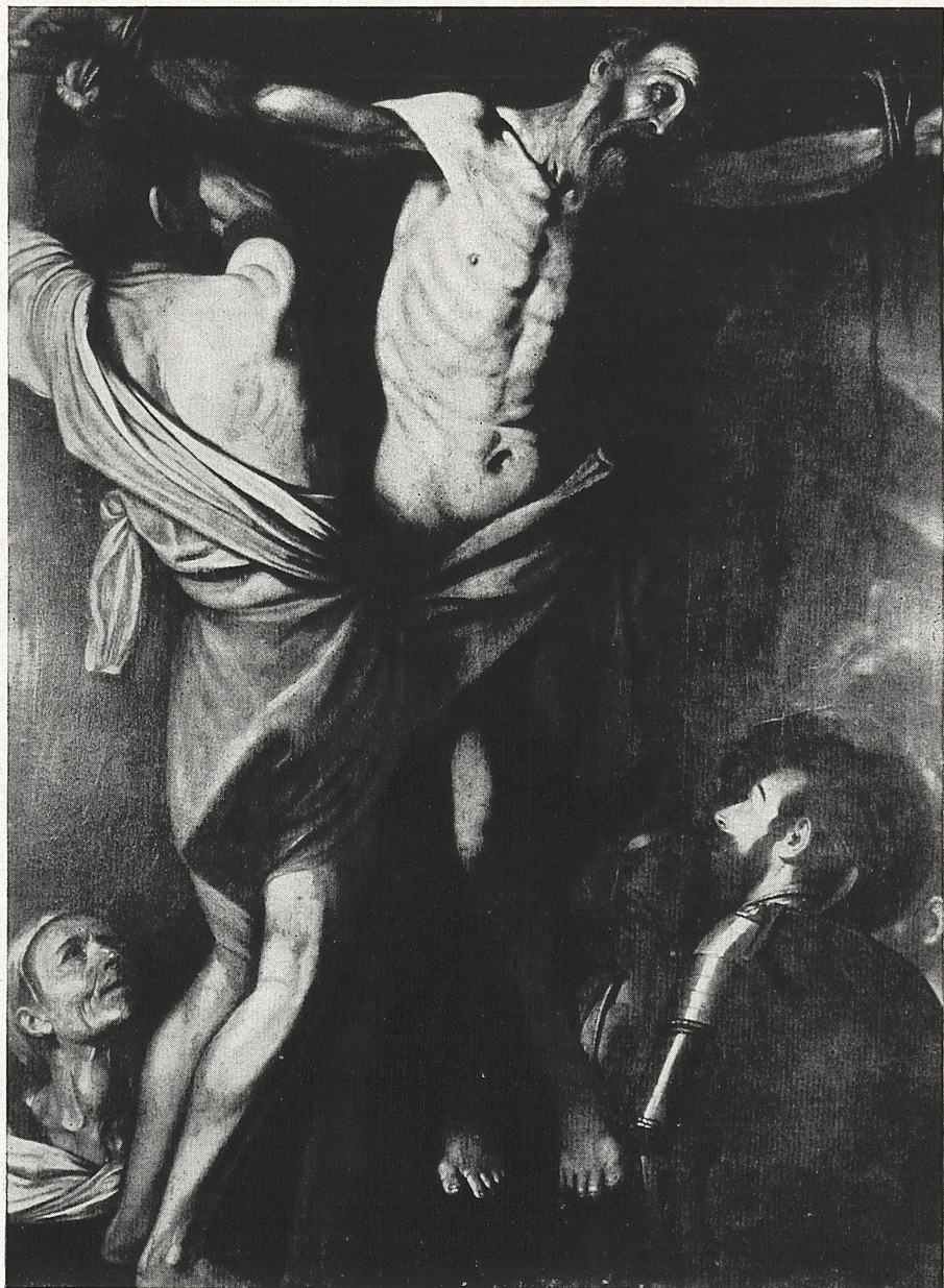
Abb. 2 Caravaggio (Kopie ?): Kreuzigung des Hl. Andreas. Wien, Privatbesitz.