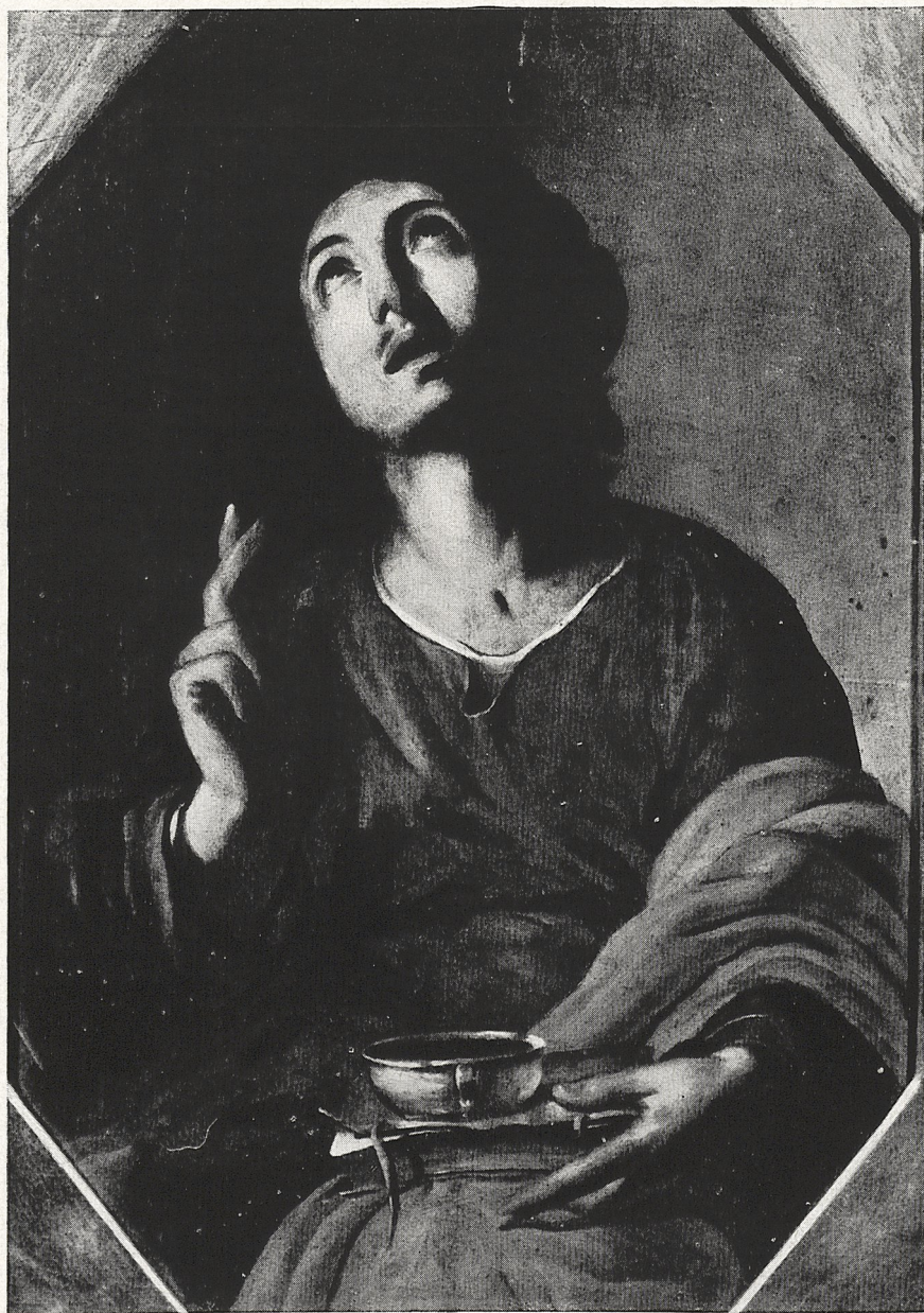
Abb. 3 Juan de Ribalta: Johannes d. E. Barcelona