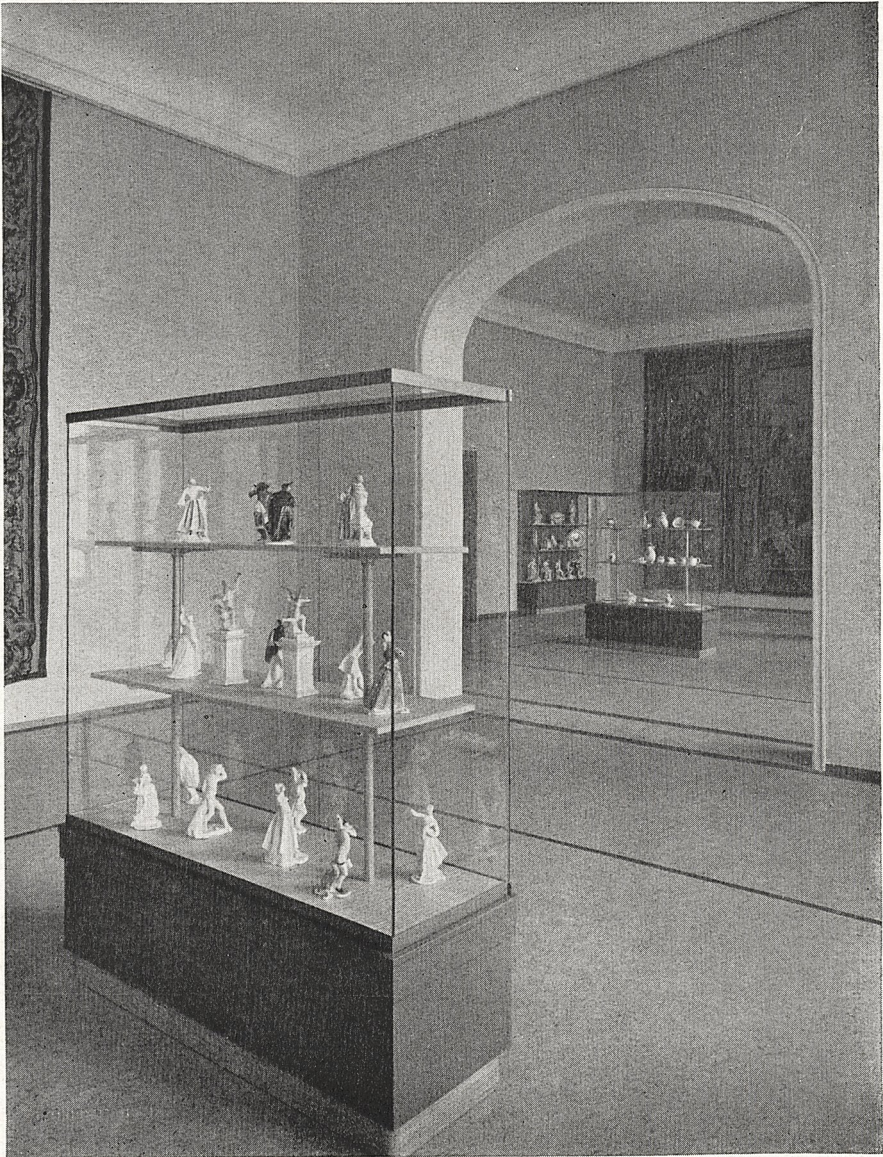
Abb. 3 München, Bayerisches Nationalmuseum. Blick in die neu eröffneten Räume