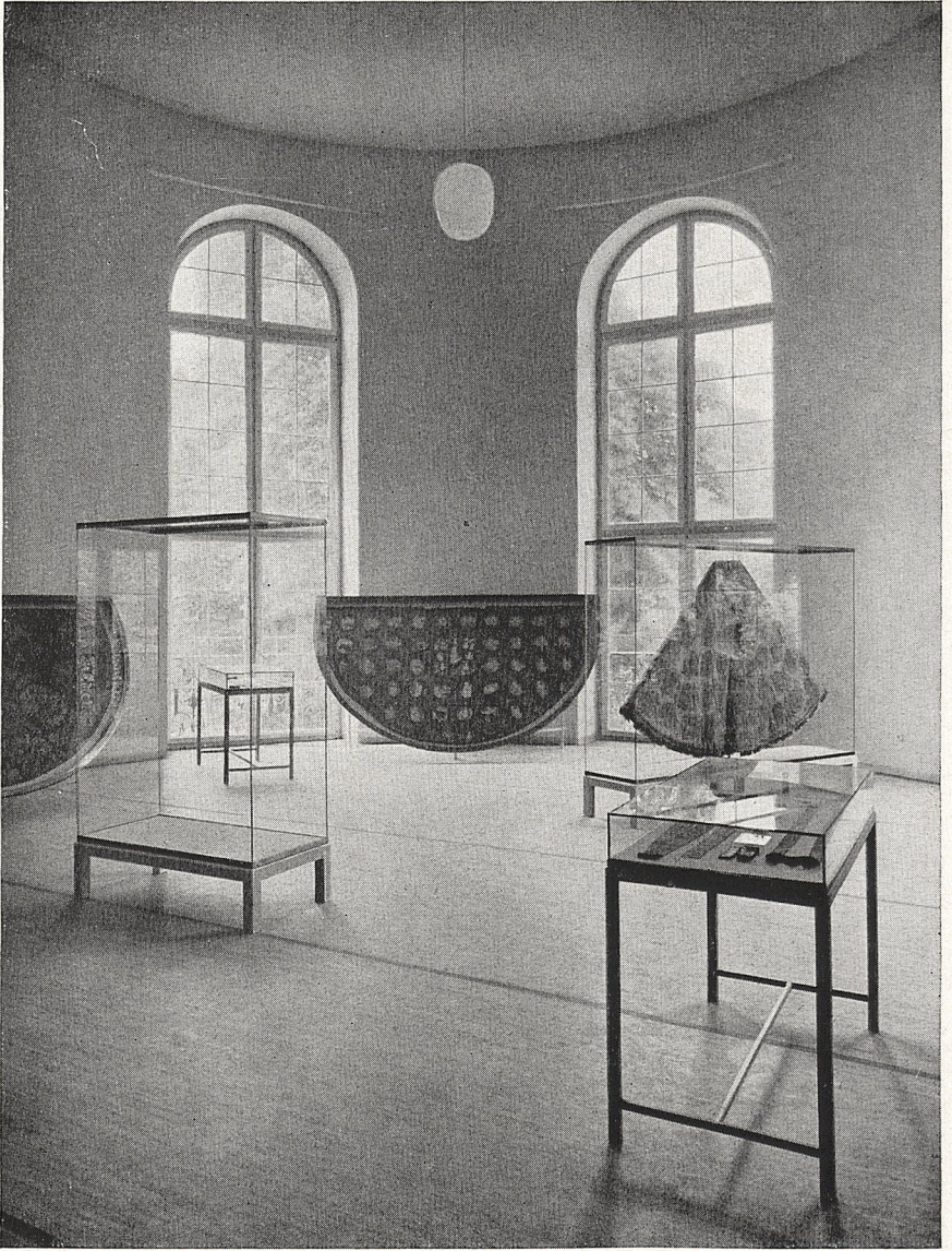
Abb. 2 München, Bayerisches Nationalmuseum. Blick in die Ausstellung „Sakrale Gewänder des Mittelalters“