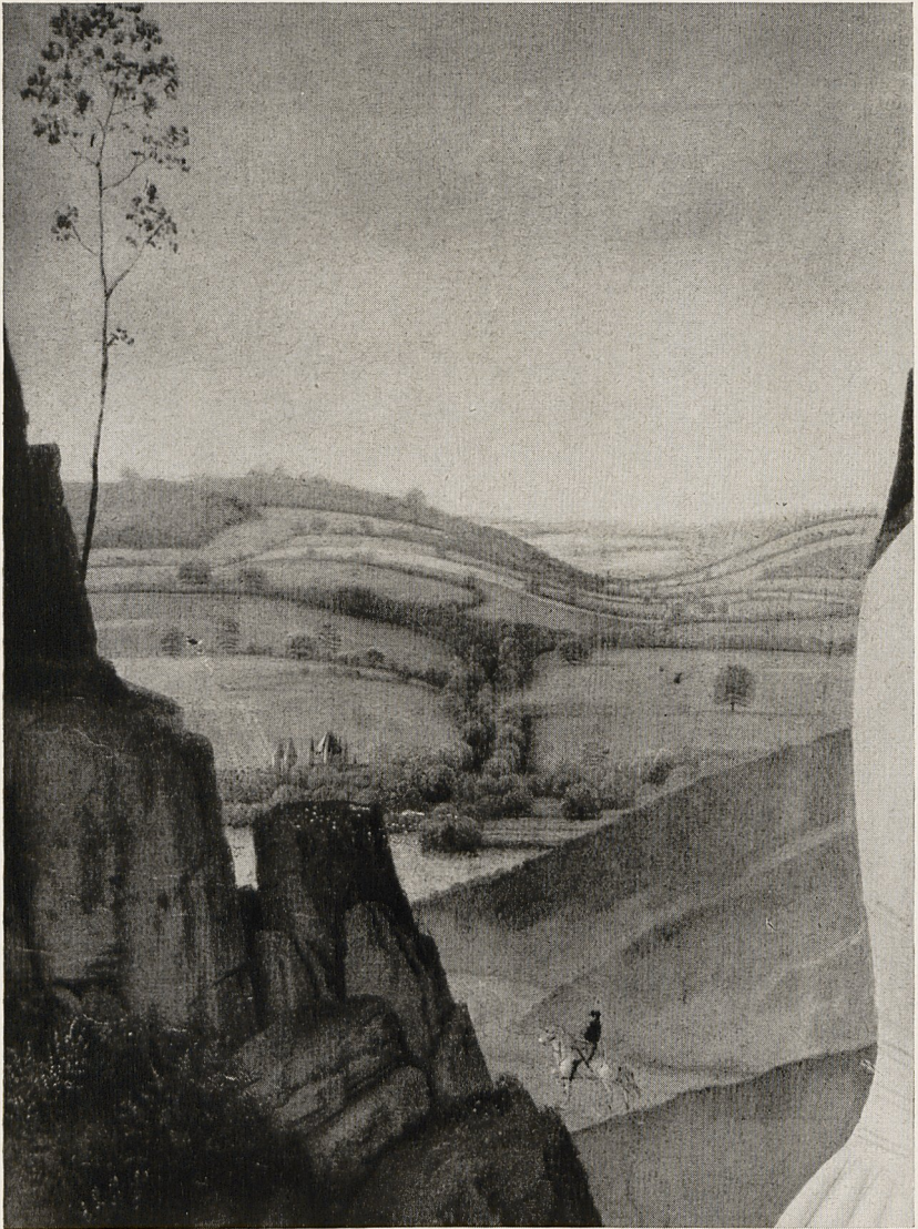
Abb. 1 Dieric Bouts: „Der Erasmusaltar (Ausschnitt). Löwen, Peterskirche.