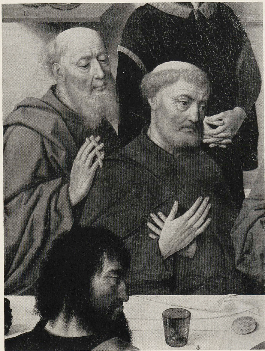
Abb. 2 Dieric Bouts: Das Abendmahl (Ausschnitt). Löwen, Peterskirche.