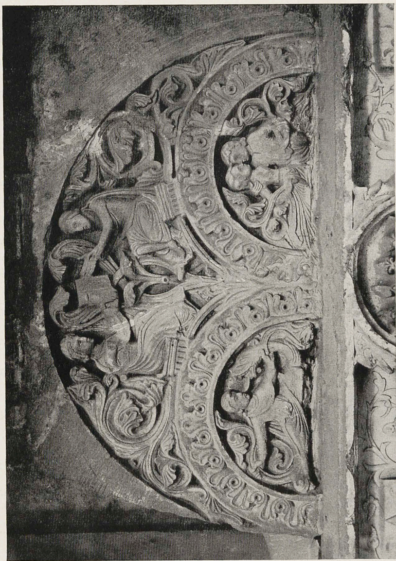
Abb. 4 Tympanon von einem Profangebäude. Reims, Musée Lapidaire