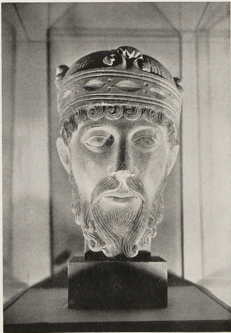
Abb. 1 Kopf des Königs Lothar von einem Kenotaph. Reims, St. Remi