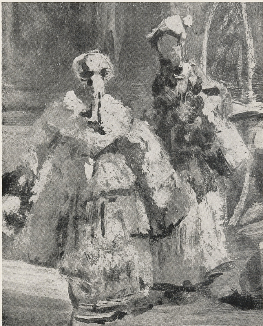
Abb. 2 Carl Spitzweg: Zollvisitation in Tirol (Ausschnitt, Makrophoto). Privatbesitz. (Ehemals Wien, Galerie Liechtenstein.)