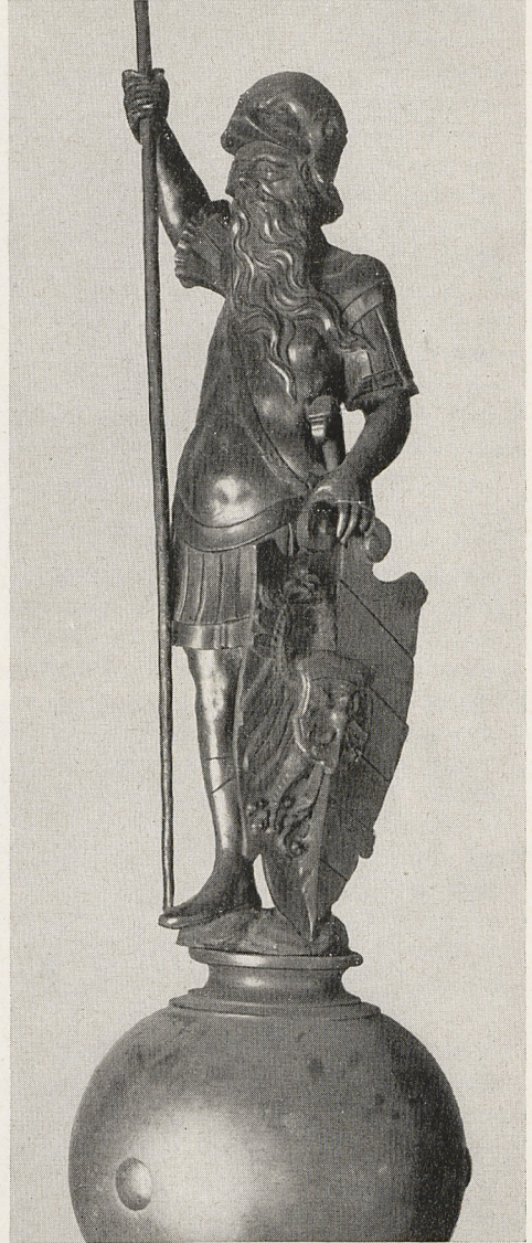
Abb. 3a und b: Brunnenfigur. Nürnberg, um 1560. Hilpoltstein, Rathaus.