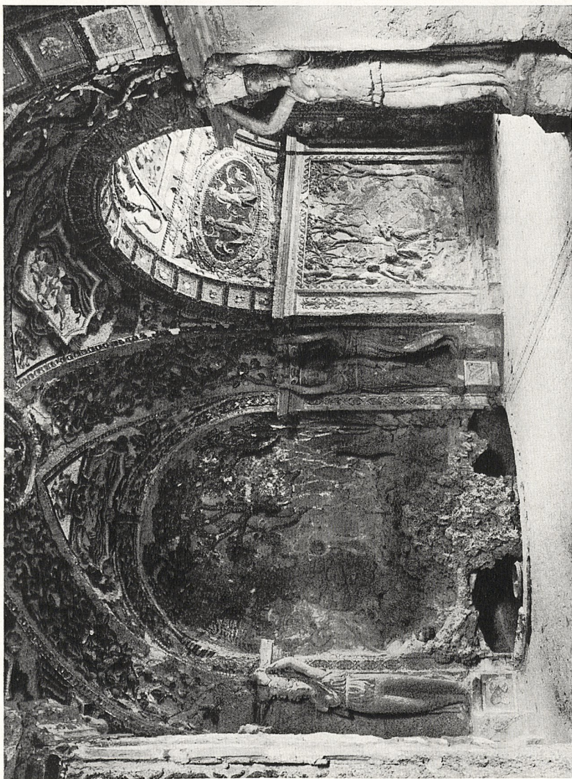
Abb. 3 Tivoli, Villa d'Este, „Die Grotte der Diana“