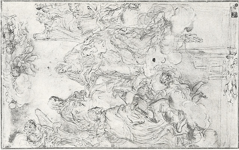
Abb. 1b Pietro da Cortona oder Carlo Maratta: Die Verlobung der hl. Katharina und der hl. Philipp Neri. Budapest, Museum der Schönen Künste