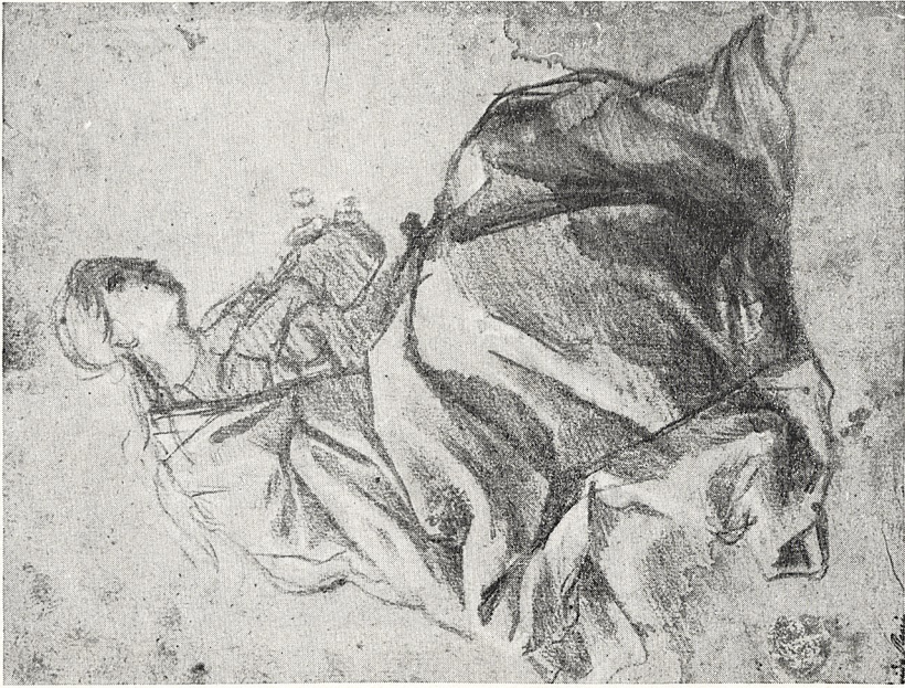
Abb. 1a Francesco Gessi: Thronende Madonna. Düsseldorf, Kunstmuseum