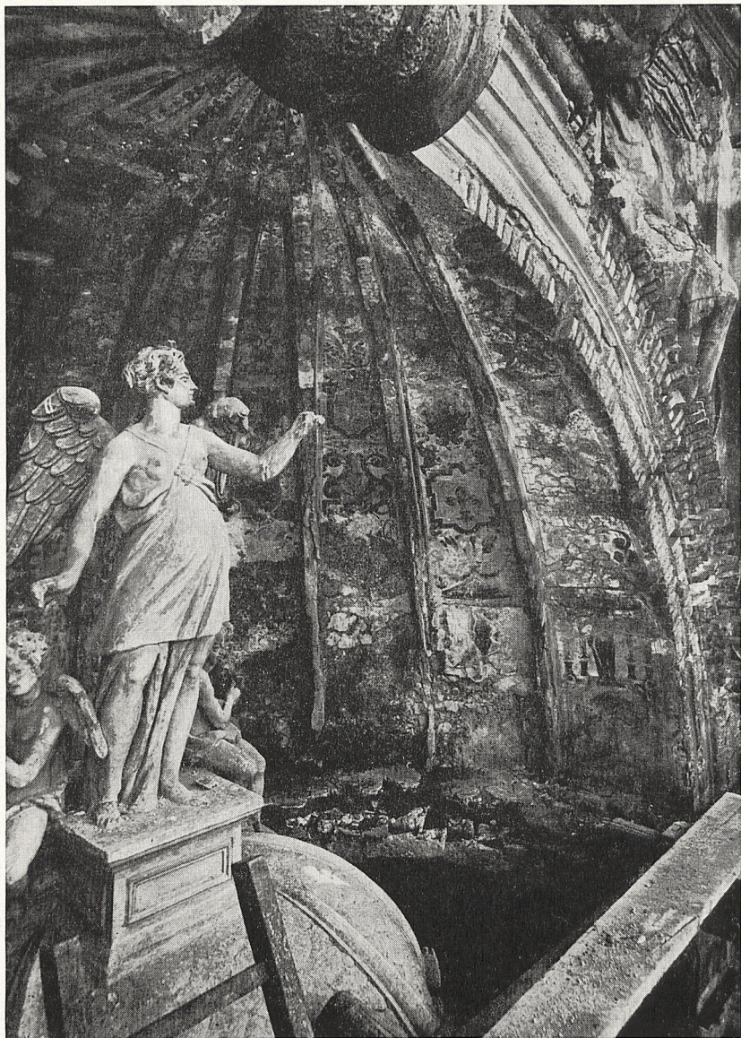
Abb. 4 Tivoli, Villa d'Este, «La Fontana dell'Organo»