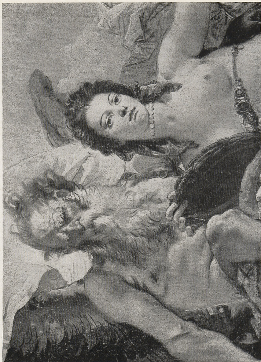
Abb. 4 Giovanni Battista Tiepolo: Der Triumph der Wahrheit (Ausschnitt). Vicenza, Museo Civico.