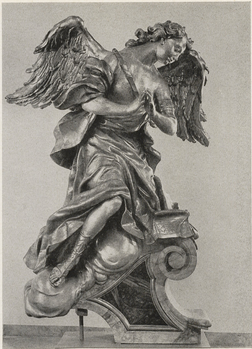
Abb. 1 Egid Quirin Asam: Engel vom Tabernakel des Hochaltars in Osterhofen-Damenstift. Altenmarkt (Ndb.).