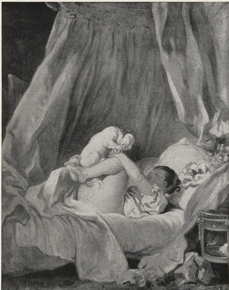
Abb. 2 Jean-Honoré Fragonard: Mädchen mit Hund. Paris, Privatbesitz.