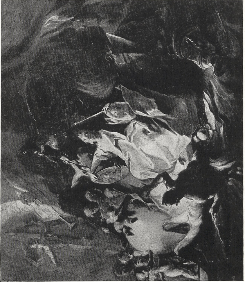
Abb. 2 Franz A. Maulbertsch: Verherrlichung des Kaiserpaars Franz I. und Maria Theresia. Grisailleskizze für ein Wandbild. München, Slg. Reuschel