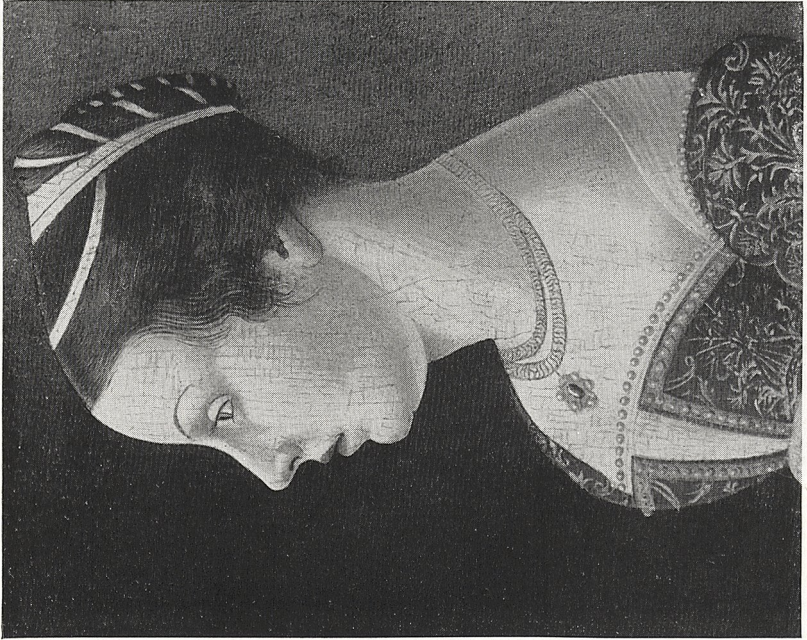
Abb. 4a Vittore Carpaccio: Damenbildnis. Philadelphia, Slg. Johnson