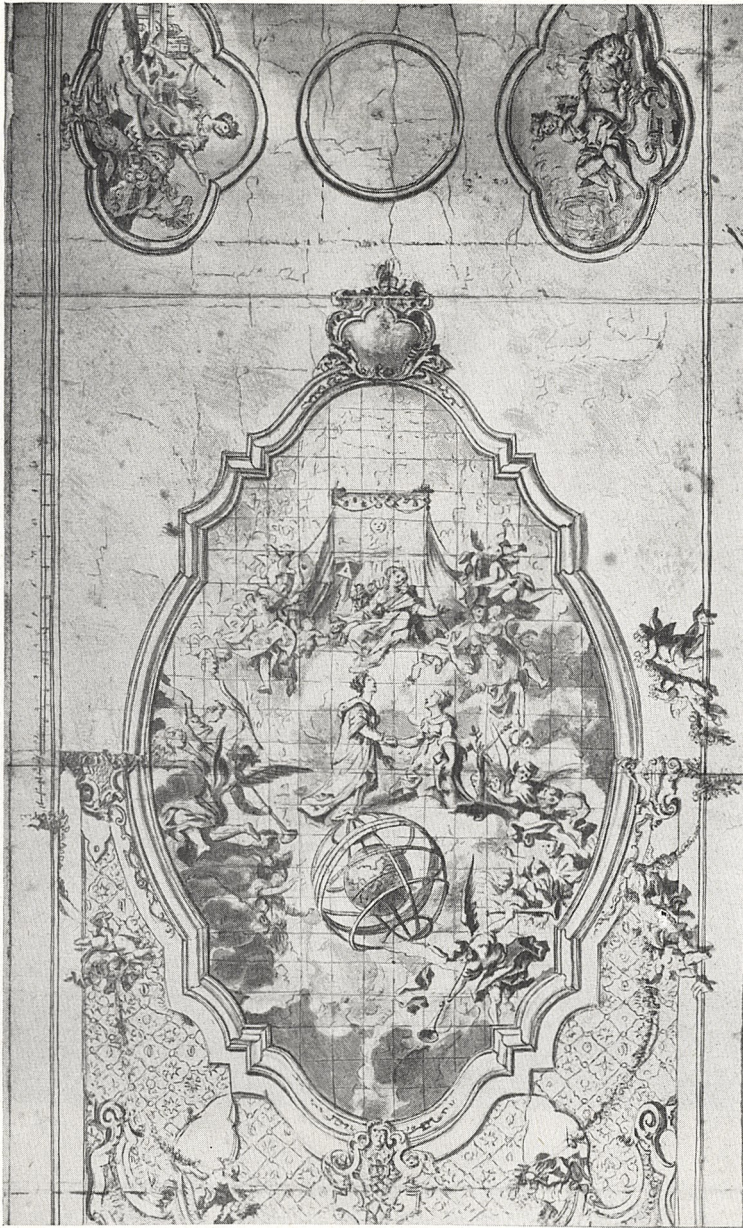
Abb. 1 Martin Puchner zugeschr.: Entwurf für die Decke des Orban-Saales, Ingolstadt. Lavierte Federzeichnung. München, Staatl. Graphische Sammlung