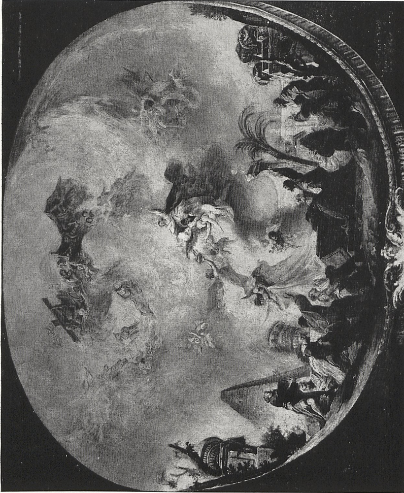
Abb. 3 Christian Wink: Himmelfahrt Mariae, Entwurf für ein Kuppelfresko. München, Slg. Reuschel