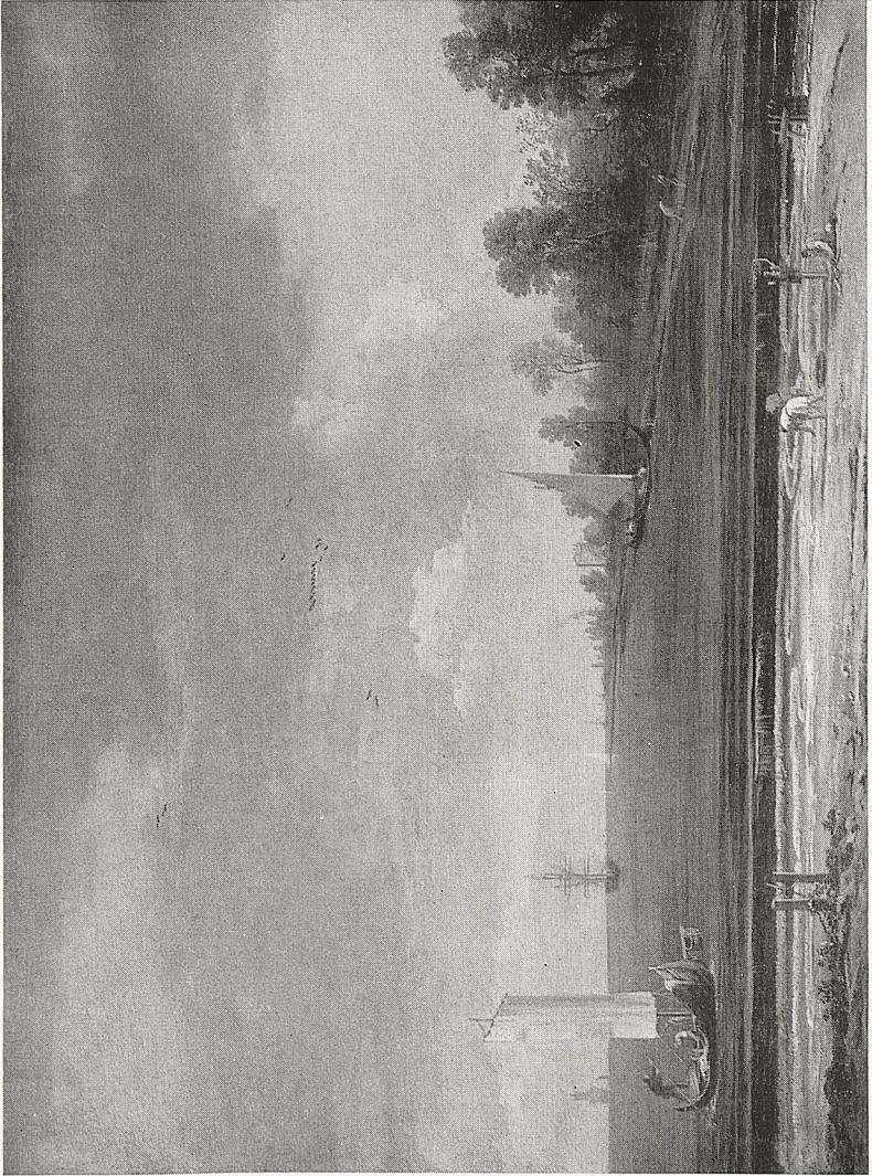
Abb. 1 Antonio Canale: Küstenlandschaft. Kreuzlingen, Privatbesitz