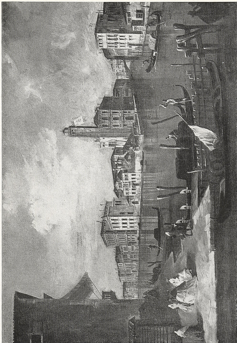
Abb. 4 Francesco Guardi: Canal Grande mit S. Geremia. Baltimore, Museum of Art