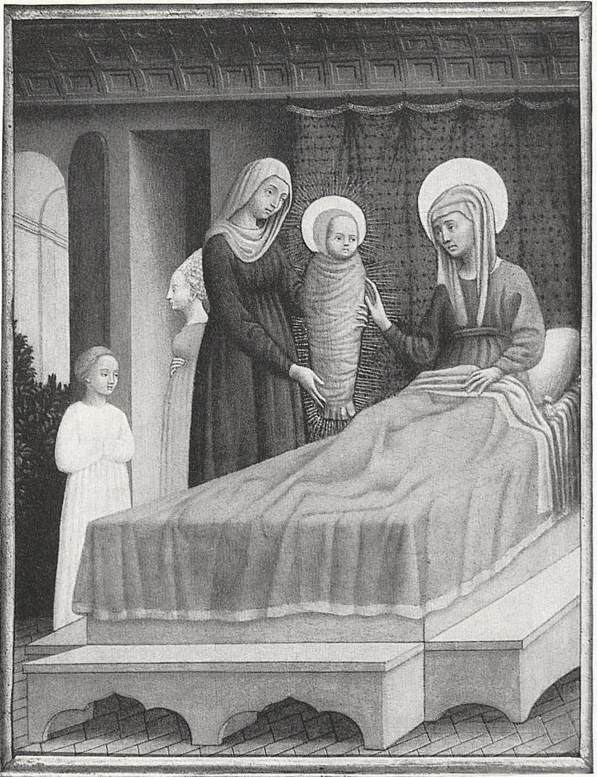
Abb. 2 Antonio Vivarini: Geburt des hl. Augustinus. London, Courtauld Institute Galleries, Lee Collection