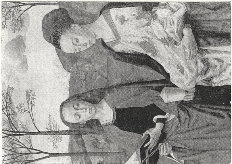
Abb. 1b Hugo van der Goes: Porinari-Altar (Ausschnitt). Florenz, Uffizien