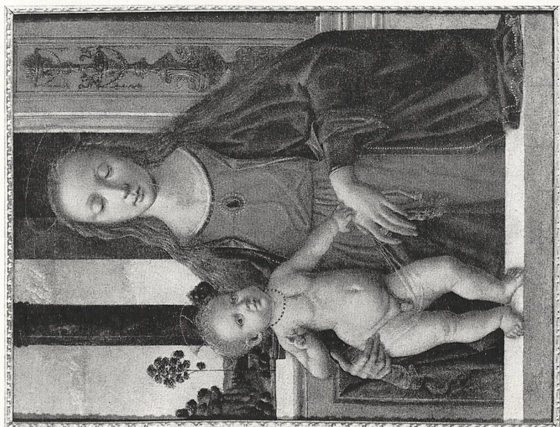
Abb. 1a Verrocchio-Schüler: Madonna mit Kind. London, Courtauld Institute Galleries, Gambier-Parry Collection