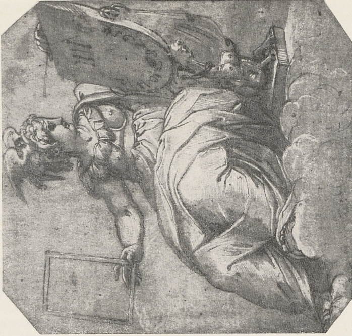
Abb. 1b Giorgio Vasari: Die vierte Hore des Tages, Düsseldorf, Kupferstichkabinett