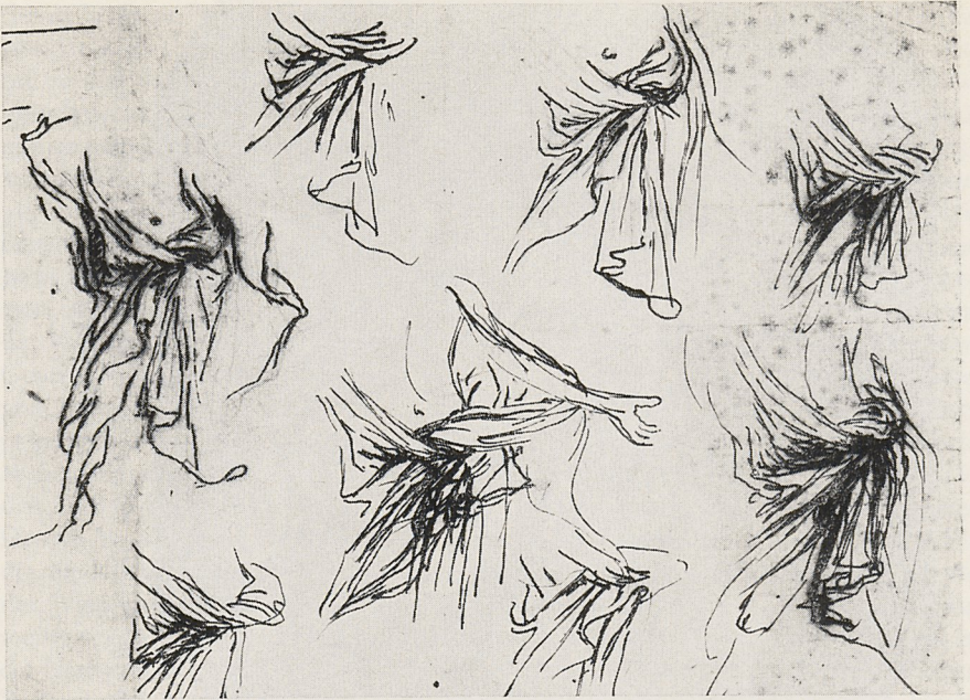
Abb. 2a Gian Lorenzo Bernini: Gewandstudien zum Longinus. Düsseldorf, Kupferstichkabinett