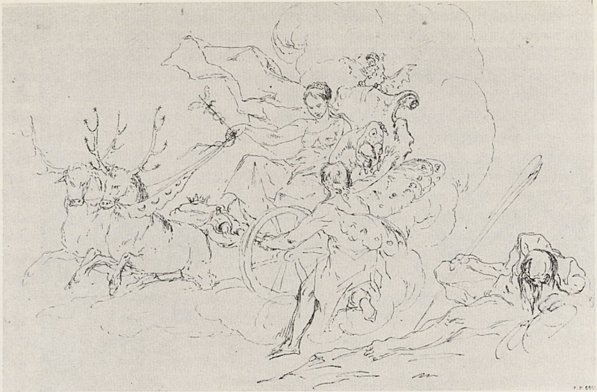
Abb. 3a Paul Troger: Fortuna in einem von Hirschen gezogenen Wagen. Düsseldorf, Kupferstichkabinett