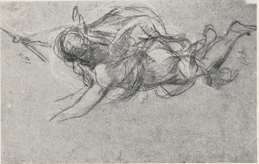
Abb. 2b Pietro da Cortona: Fliegender Apoll. Düsseldorf, Kupferstichkabinett