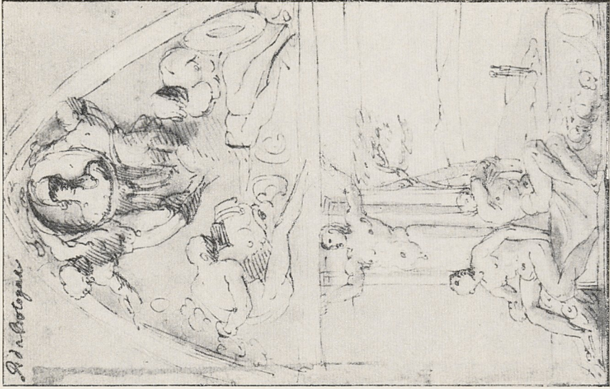
Abb. 4b Giovanni Battista Gaulli: Entwurf für eine Fensterdekoration im römischen Gesu. Düsseldorf, Kupferstichkabinett