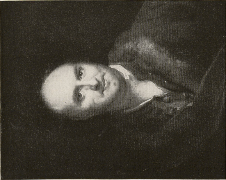
Abb. 3a Antoine Pesne: Männliches Bildnis. Heidelberg, Privatbesitz