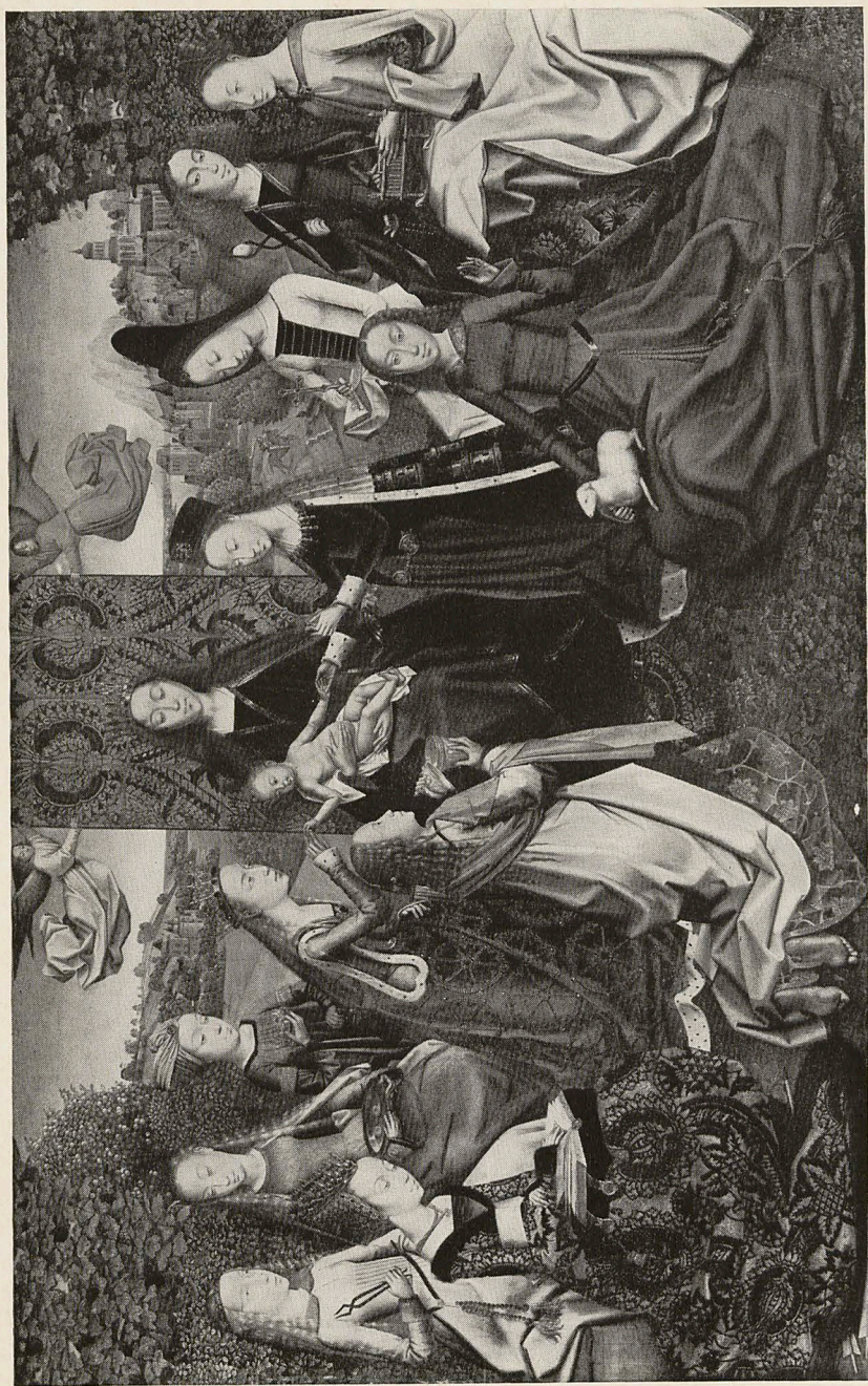
Abb. 4 Meister der Lucia-Legende: Madonna zwischen Heiligen. Brüssel, Museés royaux des Beaux-Arts