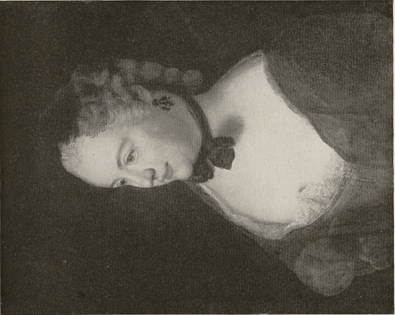
Abb. 3b Antoine Pesne: Damenbildnis, um 1750. Berlin-Dahlem, Staatl. Museen