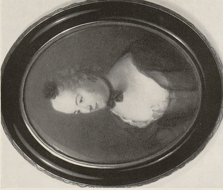
Abb. 2b Antoine Pesne: Damenbildnis, Miniatur. Heidelberg, Privatbesitz