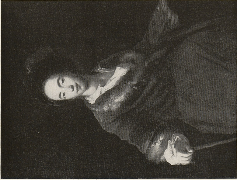
Abb. 2a Antoine Pesne: Selbstbildnis, um 1710. München, Bayer. Staatsgemäldesammlungen