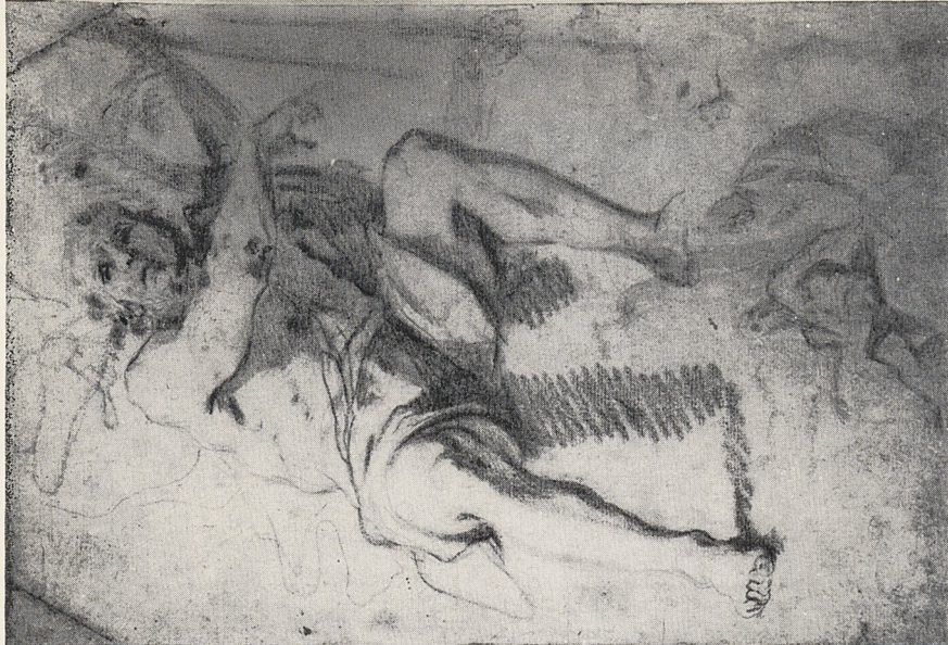
Abb. 2b Mattia Preti: Studien zu den Deckenmalereien in St. John in Valletta. Kopenhagen, Statens Museum for Kunst