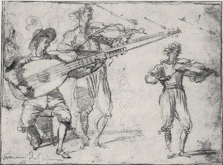
Abb. 4b Jacopo Confortini (?): Musikanten. Rötelszeichnung. Hergiswic, Slg. P. und N. de Boer