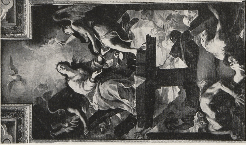
Abb. 3b Mattia Preti: Mariyum der Heiligen Katharina. Zurrieq (Malta), Pfarrkirche