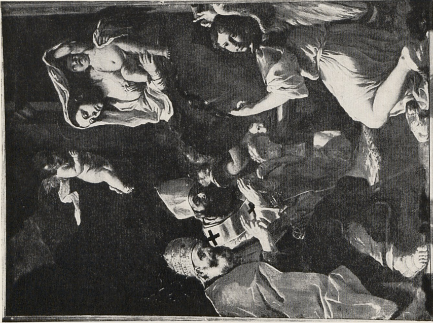
Abb. 3a Mattia Preti: Thronende Madonna mit den Heiligen Petrus und Nikolaus und dem Erzengel Raphael. Lija (Malta), Tal-Mirakli-Kirche