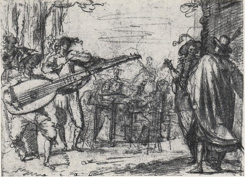
Abb. 4a Jacopo Confortini (?): Wirtshausszene mit Musikanten. Rötelszeichnung. Weimar, Schloßmuseum