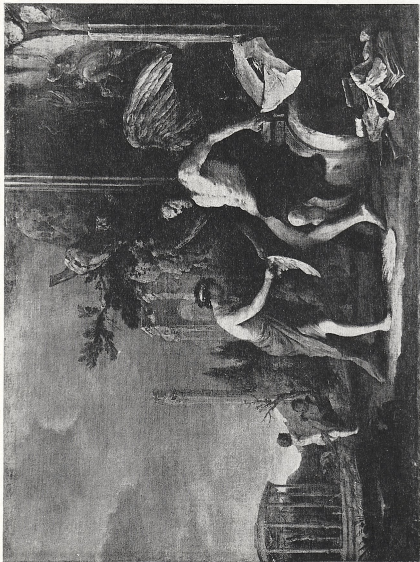
Abb. 6 Johann Heinrich Schönfeld: Ungedeutete Szene. Rom, Galleria Nazionale d'Arte Antica