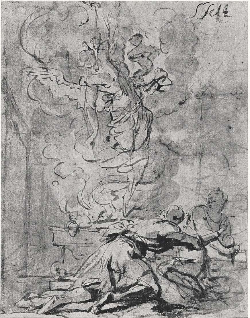
Abb. 8 Johann Spillenberger (zugeschrieben): Das Opfer des Manoah. Berlin-Dahlem, Staatliche Museen, Kupferstichkabinett