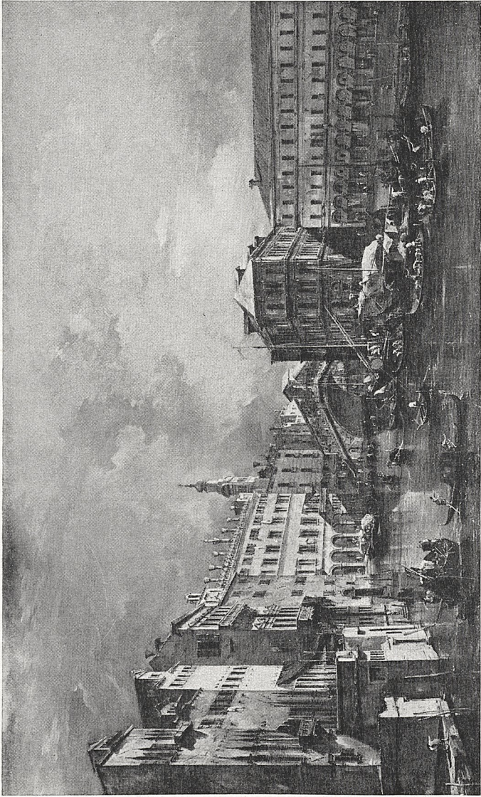
Abb. 3 Francesco Guardi: Rialto und Palazzo dei Camerlenghi. München, Bayer. Staatsgemäldesammlungen