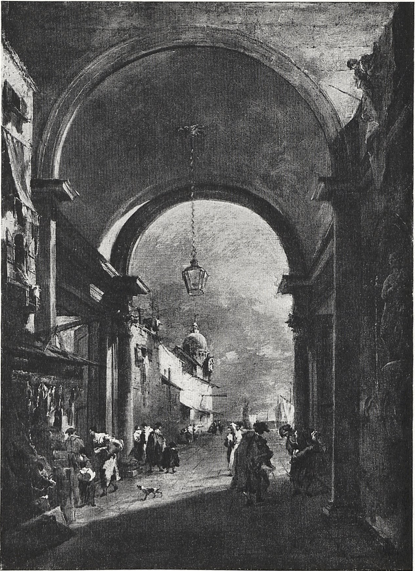
Abb. 5 Francesco Guardi: Tordurchblick. München, Bayer. Staatsgemäldesammlungen