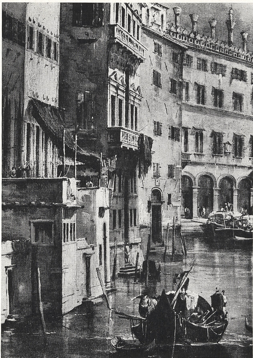
Abb. 4 Francesco Guardi: Rialto und Palazzo dei Camerlenghi (Ausschnitt). München, Bayer. Staatsgemäldesammlungen