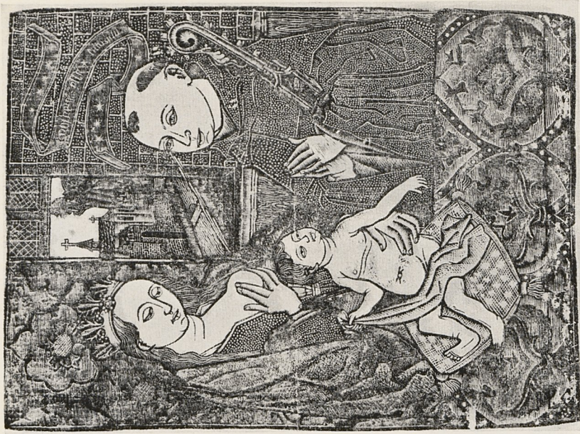
Abb. 1b Köln, um 1480: Vision des hl. Bernward. Kolorierter Metallschnitt. Nürnberg, Germanisches Museum