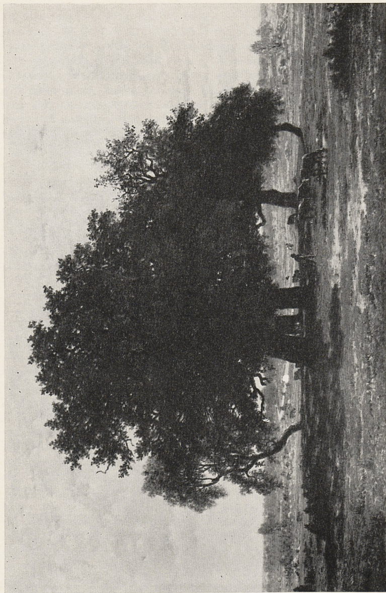
Abb. 2 Théodore Rousseau: Groupe de Chênes, Apremont. Paris, Musée du Louvre