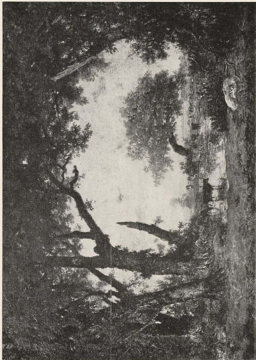
Abb. 3 Théodore Rousseau: Sortie de la forêt de Fontainebleau . Paris, Musée du Louvre