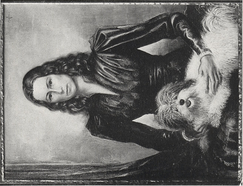
Abb. 4a Otto Dix: Damenporträt, 1940. Privatbesitz