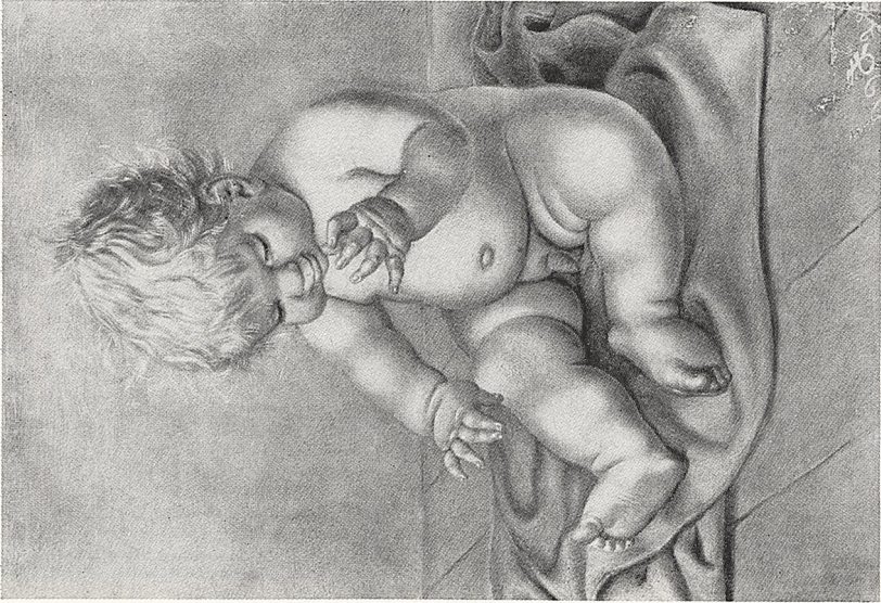
Abb. 3a Otto Dix: Sitzendes Kind, 1928, Pinselzeichnung auf farbigem Papier. Privatbesitz