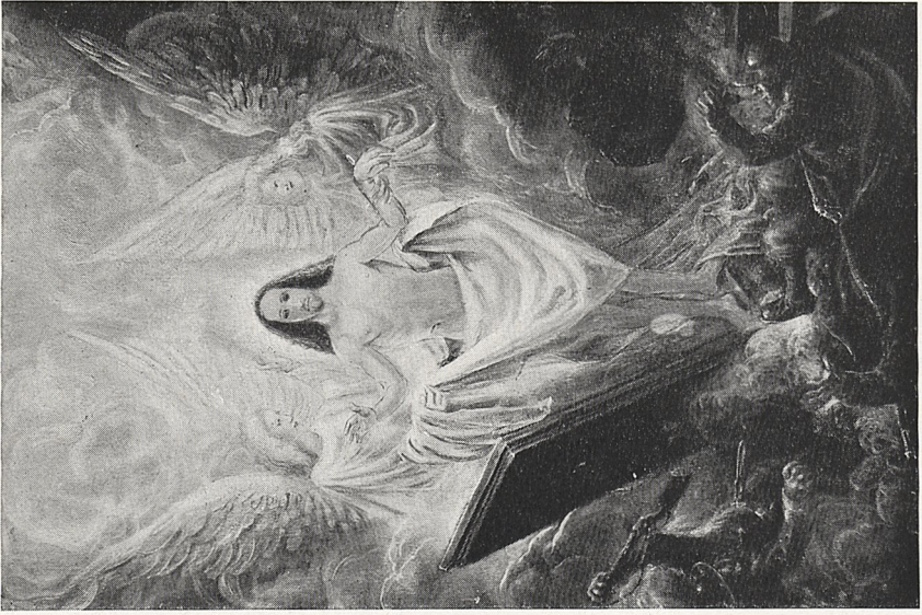
Abb. 4b Otto Dix: Auferstehung Christi, 1943. Privatbesitz