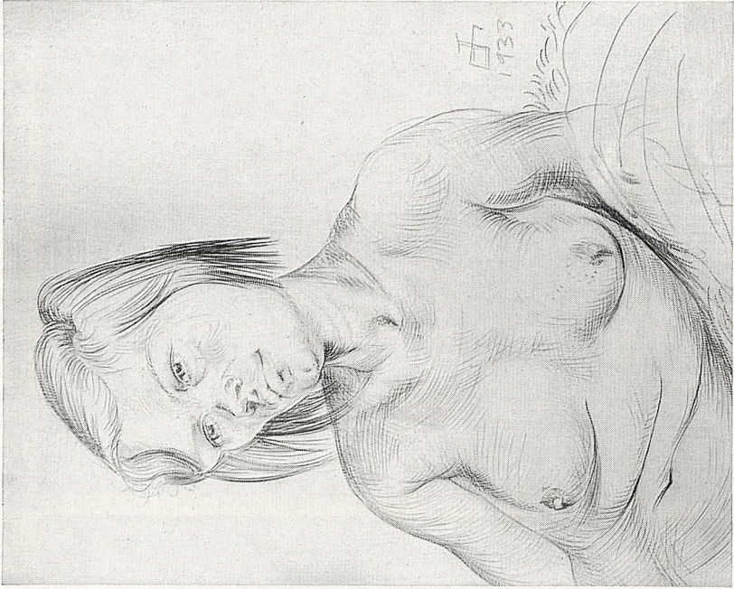
Abb. 3b Otto Dix: Weiblicher Akt, 1933, Zeichnung. Köln, Slg. Hautbrich