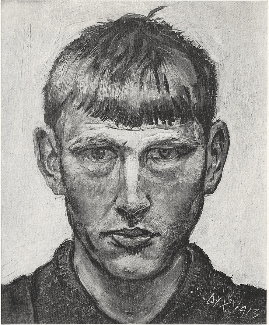
Abb. 1 Otto Dix: Selbstbildnis, 1913. Stuttgart, Staatsgalerie