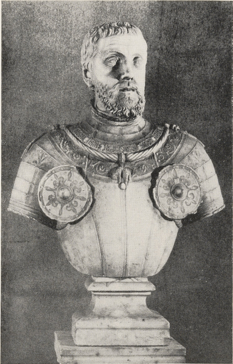
Abb. 4 Italienisch, 16. Jahrhundert: Büste Karls V. Neapel, Museo di S. Martino