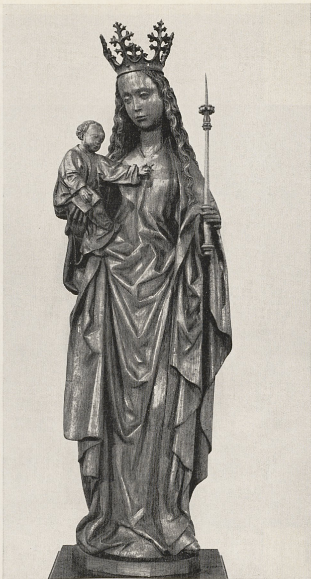
Abb. 1 Muttergottes. Nordniederlande, 3. Viertel 15. Jahrhundert. Vreden, St. Georg