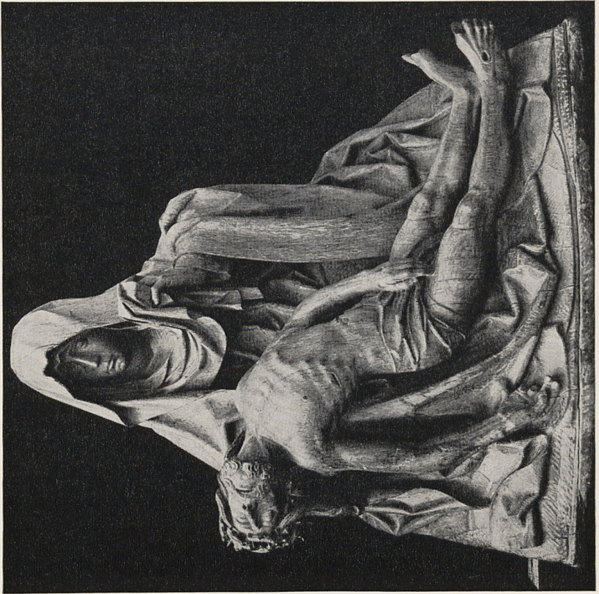
Abb. 2 Marienklage. Niederrhein, um 1500. Rheinberg, St. Peter