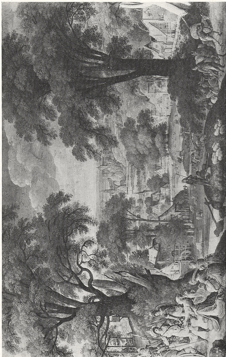
Abb. 2 Hans Bol: Abigail und David, 1587. Dresden, Gemäldegalerie