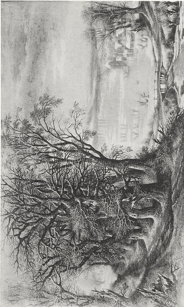
Abb. 1 Denis van Alsloot: Winterlandschaft; 1614. Mosigkau, Schloß