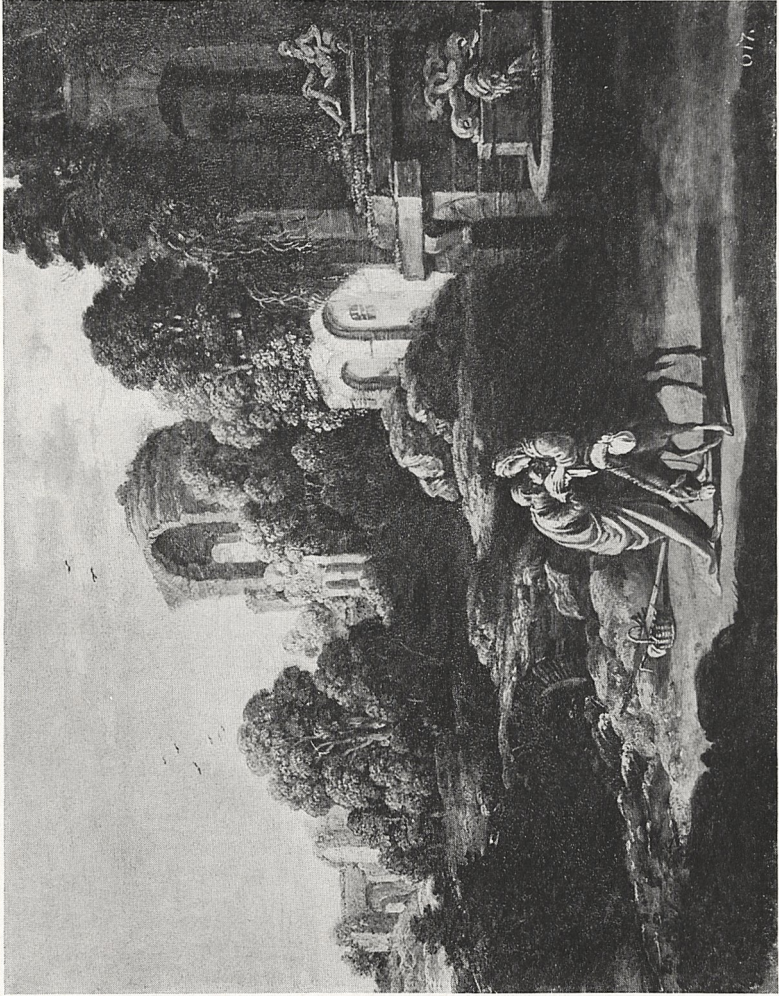
Abb. 4 Jacob Pynas (zugeschr.): Landschaft mit der Flucht nach Ägypten. Dresden, Gemäldegalerie