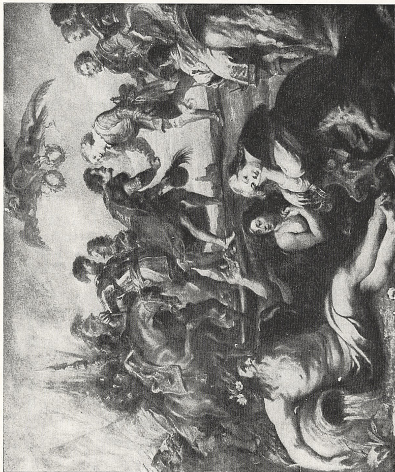
Abb. 2 P. P. Rubens: Begegnung des Kardinalinfanten Ferdinand mit König Ferdinand von Ungarn vor der Schlacht bei Nördlingen. Wien, Kunsthist. Mus.