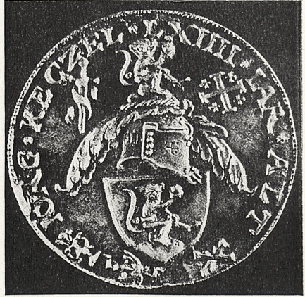
Abb. 4c Nürnberg, um 1525: Bildnismedaille des Georg Ketzler, Rückseite