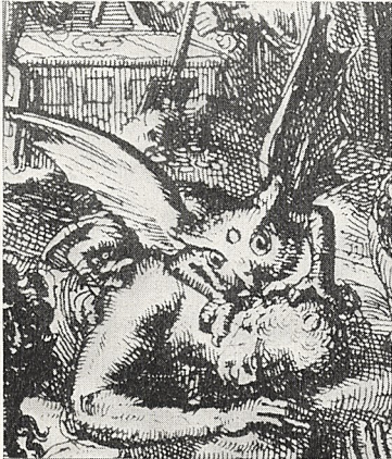
Abb. 4b Illustration aus der „Hieroglyphica“ des Romeyn de Hooghe: „Nachtmähre oder der Alp“