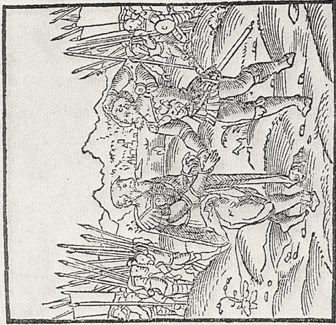
Abb. 1b Concordia-Emblem aus dem „Emblematum Liber“ des Andreas Alciatus (hier nach der franz. Ausgabe. Paris 1542, S. 49)