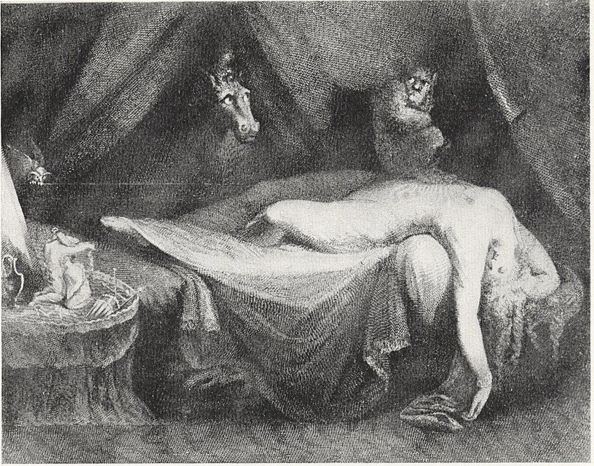
Abb. 4a William Raddon: Stich nach verlorener Version von Füssli's „Nachtmahr“