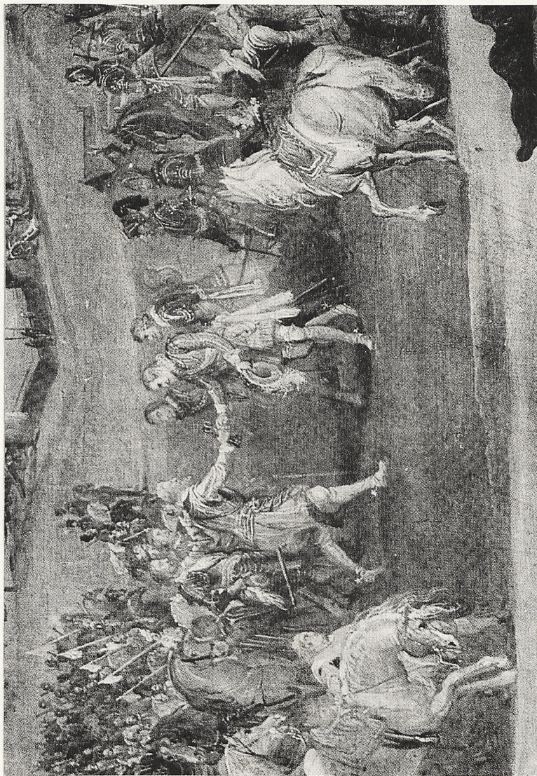
Abb. 3 P. P. Rubens: Die Einnahme von Jülich; aus dem Medici-Zyklus (Ausschnitt). Paris, Louvre