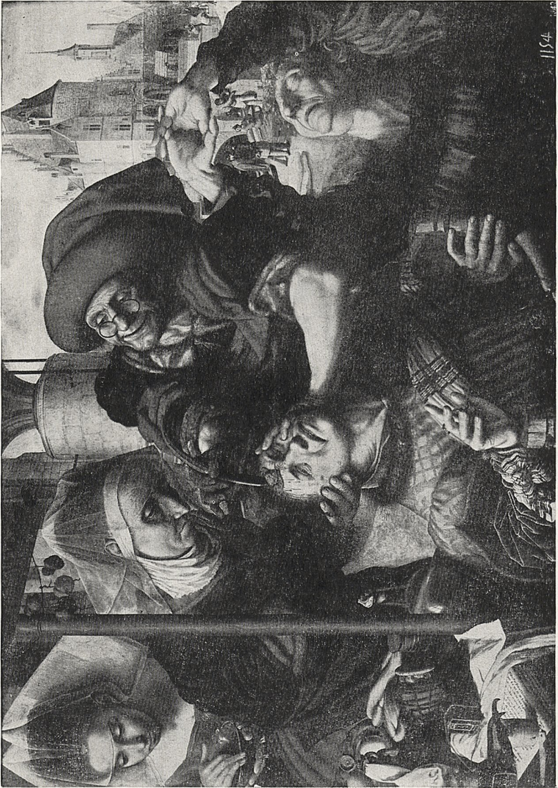
Abb. 4 Jan van Hemessen (?) u. Braunschweiger Monogrammist: Die Steinoperation. Madrid, Prado