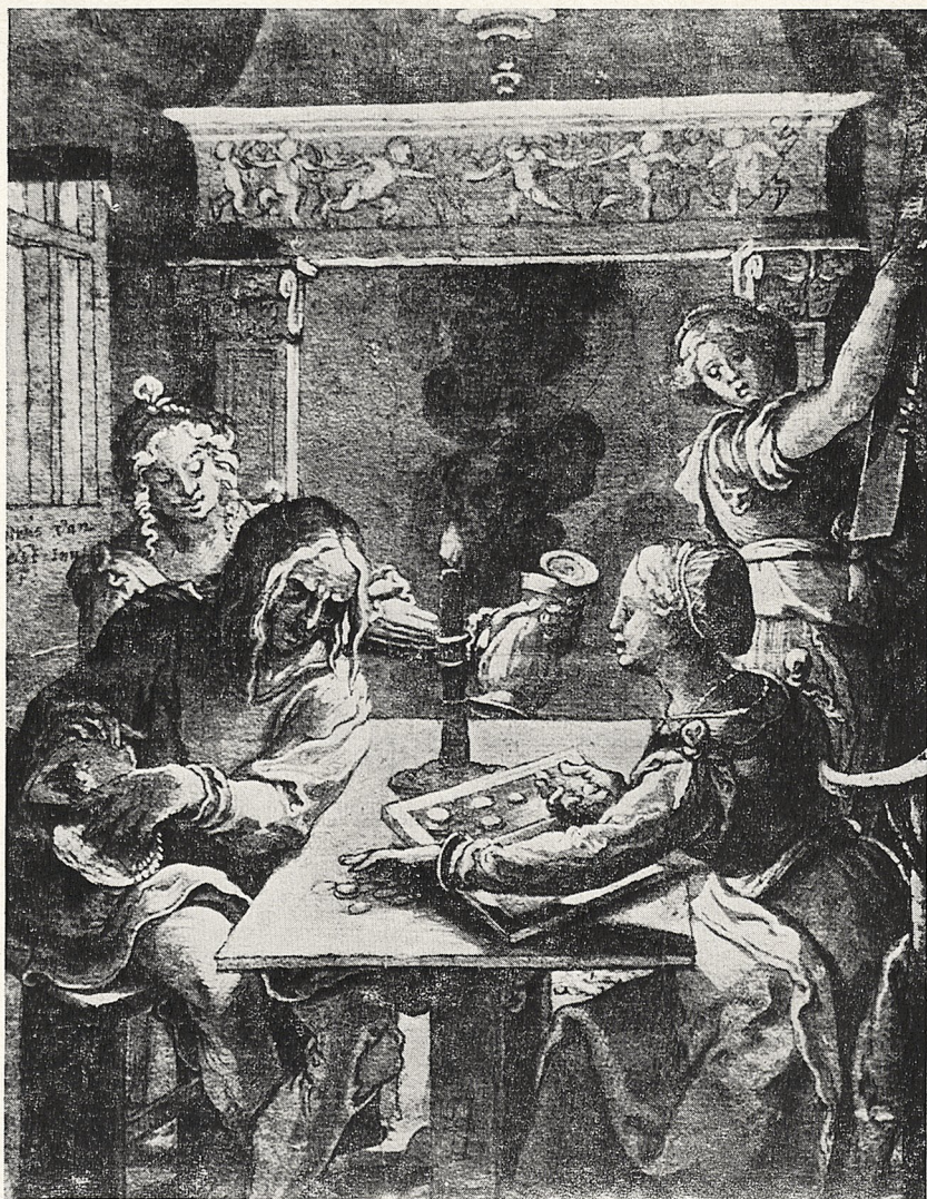
Abb. 1 Pieter Coecke v. Aelst: Der verlorene Sohn bei den Huren. 1529(?). Rotterdam, Museum Boymans-van Beuningen