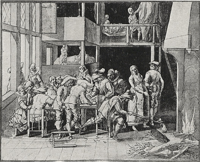
Abb. 3b Jan Le Ducq (?): Bordellszene. Nachzeichnung nach dem Bild Abb. 3a. Dresden, Kupferstichkabinett