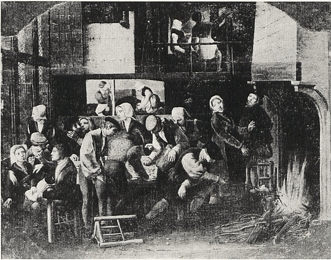
Abb. 3a Braunschweiger Monogrammist: Bordellszene. Ehemals Wien, Slg. Lanckoronski