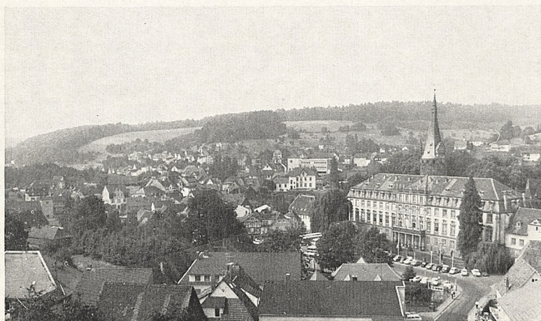
Abb. 2b Erbach/Odenwald, Blick von Osten auf Schloß und Schloßplatz; links im Mittelgrund die Baumgruppen des Lustgartens