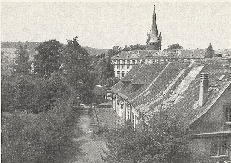
Abb. 3a Erbach/Odenwald, Orangerie mit einem Teil des Lustgartens; dahinter aufragend das Schloß mit Bergfried