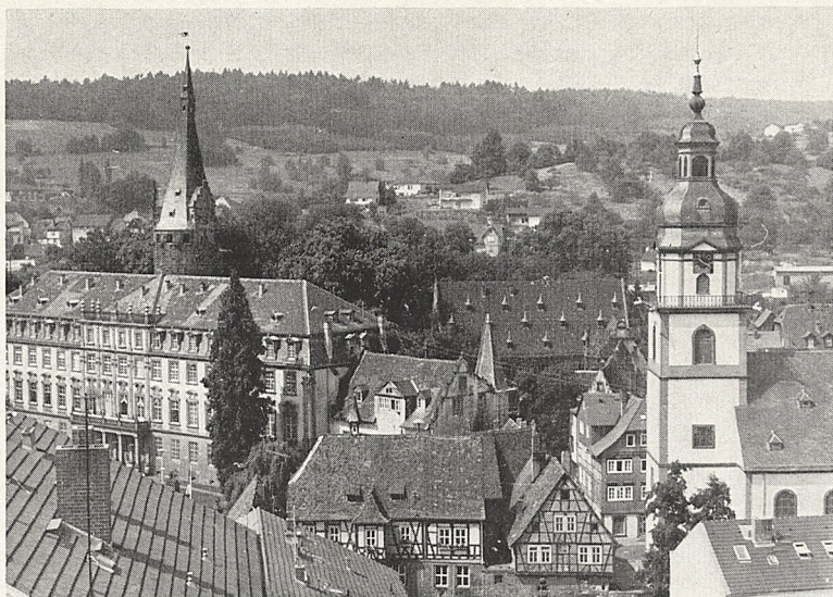
Abb. 2a Erbach/Odenwald, Blick auf Schloß, Altes Rathaus, Stadtkirche und Teile des „Städtels“