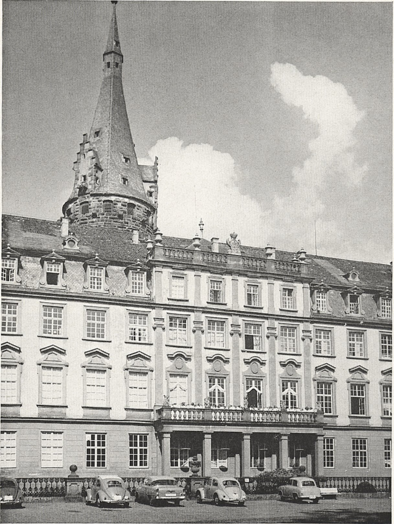
Abb. 4 Erbach/Odenwald, Schloß mit Bergfried