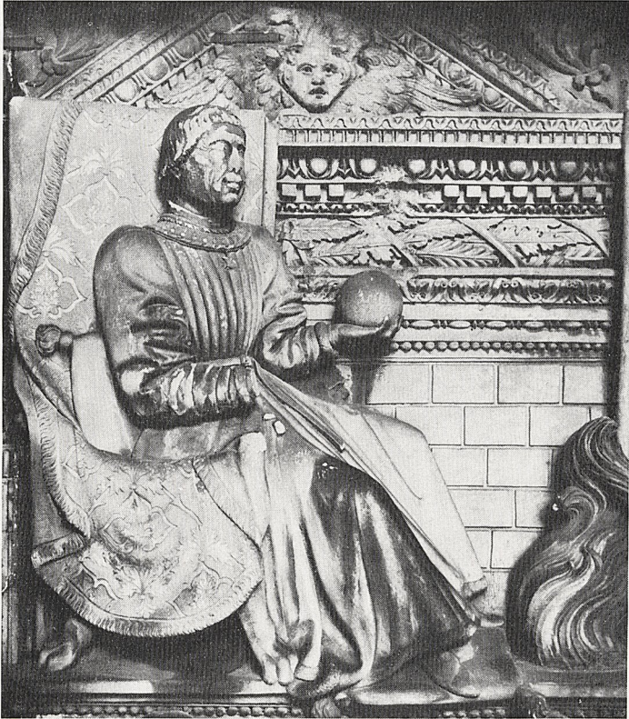
Abb. 4 Pietro da Milano: Triumphzug Alfonsos I. (Detail). Neapel, Castelnuovo