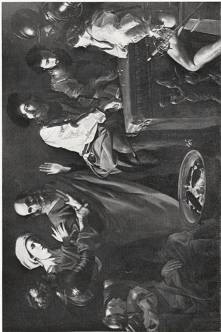
Abb. 3 Nicolas Tournier: Verleugnung Petri. Privatbesitz