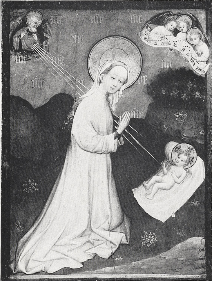
Abb. 2 Kölnisch, 1. V. 15. Jh.: Anbetung des Kindes. Kreuzlingen, Slg. Heinz Kisters