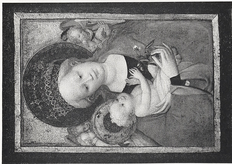
Abb. 4a Kölnisch oder Westfälisch, um 1420: Muttergottes mit der Erbsenblüte. Ottawa, National Gallery of Canada