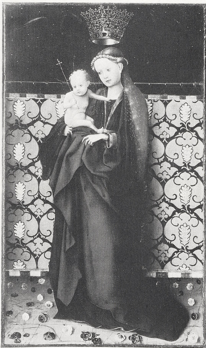
Abb. 3 Stefan Lochner (zugeschr.): Muttergottes, von Engeln gekrönt. Cleveland (Ohio), The Cleveland Museum of Art