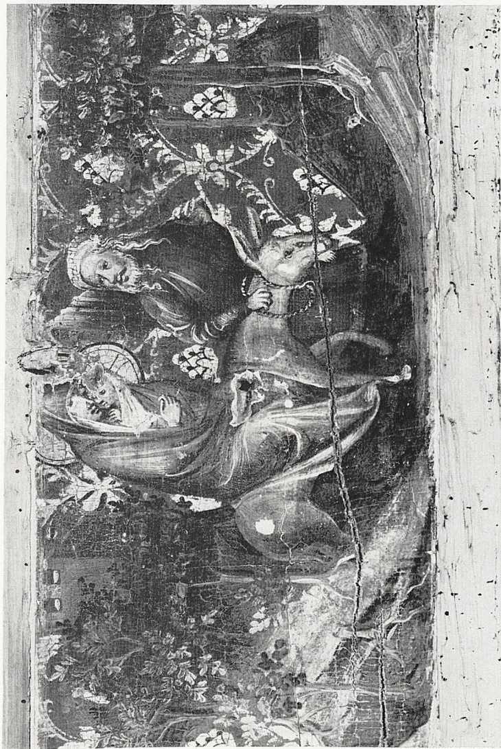
Abb. 1 Kölnisch, Ende 14. Jh.: Bruderschaftsbalken der Kammengießerei. Ausschnitt: Flucht nach Ägypten. Köln, Dom