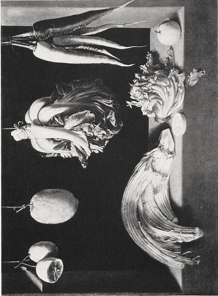
Abb. 4 Juan Sánchez Cotán: Stilleben. Madrid. Slg. Varez-Fisa