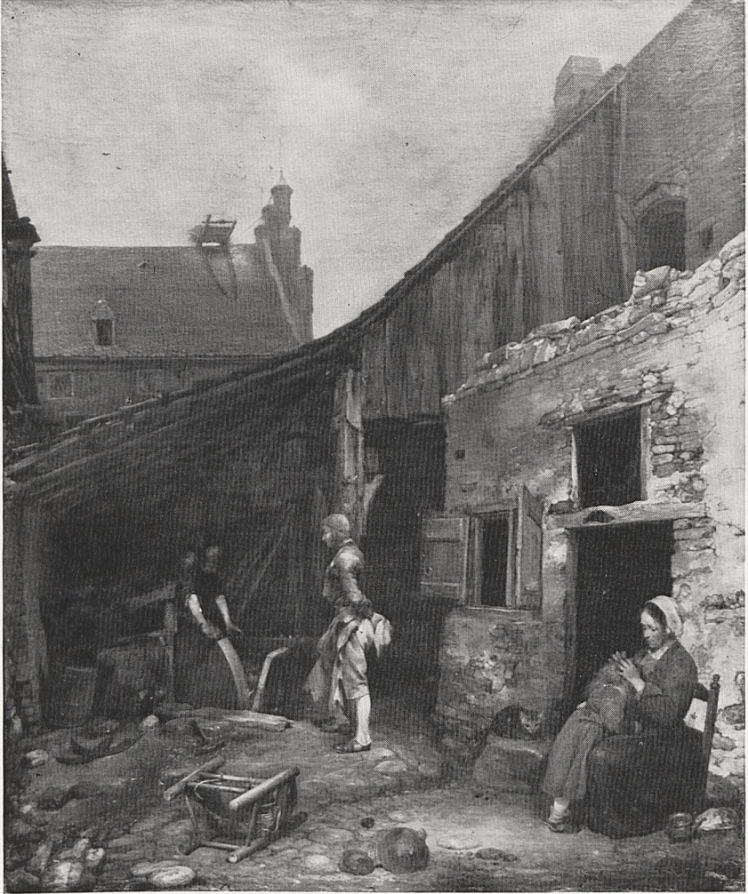
Abb. 3 Gerard ter Borch: Die Familie des Schleifers. Berlin, Staatliche Museen Preussischer Kulturbesitz, Gemäldegalerie