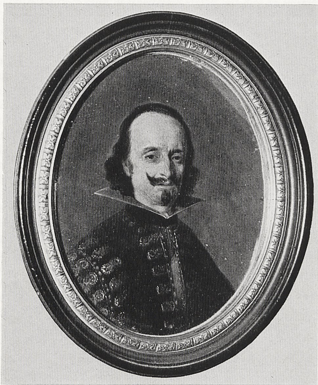
Abb. 2 Gerard ter Borch: Bildnis des Grafen Penderanda. Rotterdam, Museum Boymans van Beuningen