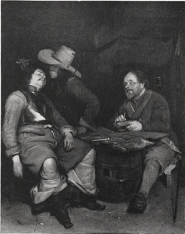
Abb. 1 Gerard ter Borch: Die Wachstube. Kettwig, Slg. Girardet